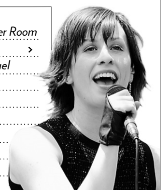
Alanis Morissette

SD : semaine dernière CS : cette semaine