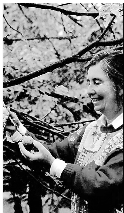
Diana Beresford-Kroeger.

« Au moins 50 % des médicaments viennent des arbres et des plantes. J'ai peur qu'on surexploite », s'inquiète d'ailleurs M me Be-