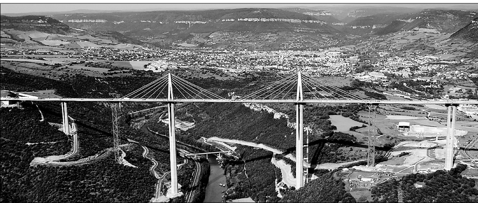
Si sa mise en service a lieu comme prévu le 17 décembre 2004, il n'aura fallu que 38 mois pour ériger le viaduc de Millau, le plus haut du monde.