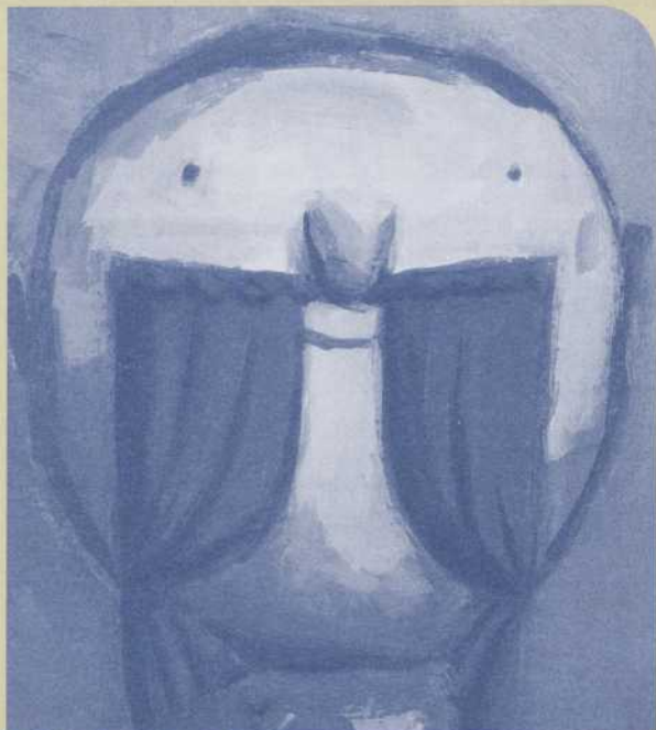
Détail de l'image de saison 2006-2007