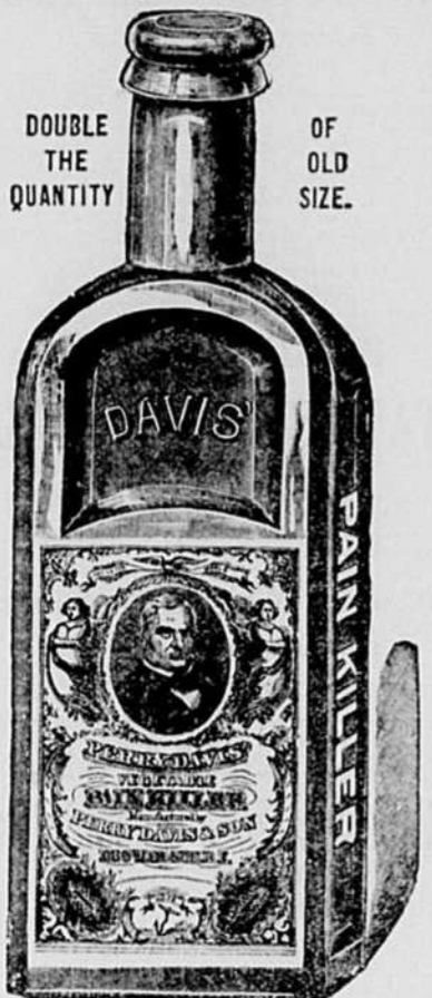
Old Popular 25c. Price.

JUST OUT! HAVE YOU SEEN IT? THE BIG BOTTLE PAIN-KILLER