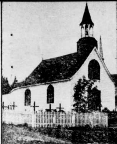
Chapelle de Tadoussac construite par le Père Coquart, en 1747 et qui intéresse encore historiens et touristes.

I l est bien certain que le légendaire "royaume du Saguenay" avec ses riches cités et ses gens "vêtus de drap de laine", n'a jamais existé. Mais en France et ailleurs on y a cru longtemps.