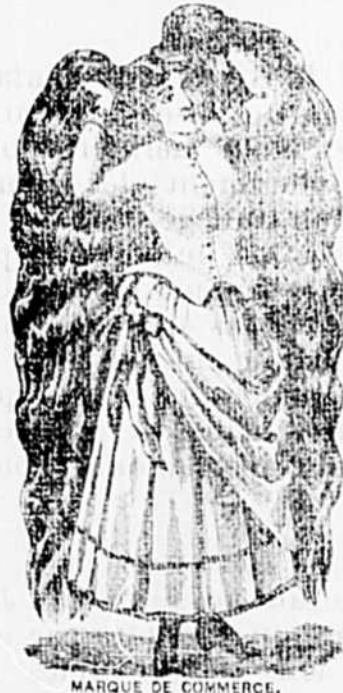
MARQUE DE COMMERCE.

Robson rend aux cheveux leur noir primitif, mais il possède de plus la précieuse propriété de les assouplir et de leur donner un lustre incomparable. Essayez ce Restaurateur, et vous serez pleinement satisfait. Prix 50 cts la bouteille. Vendu chez tous les marchands et chez L. ROBITAILLE, Pharm, Joliette.