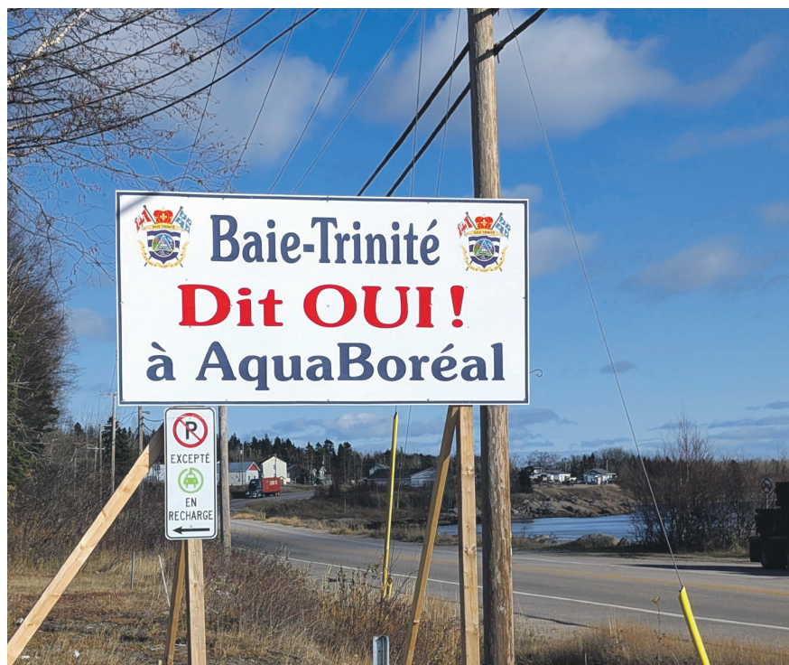
C'est à Baie-Trinité que s'établira le projet de production de saumon AquaBoreal.

L'entreprise continuera d'informer les citoyens de Baie-Trinité et de la Manicouagan des avancées du projet.