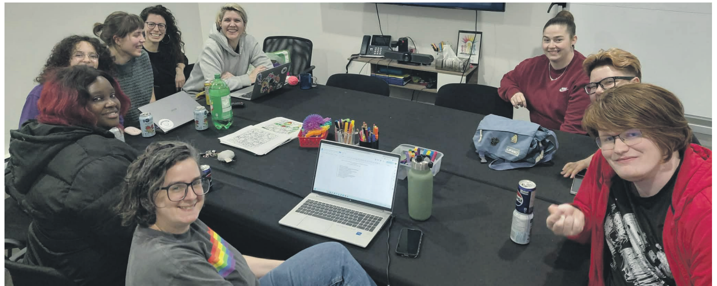
Queer Nord n'a pas eu de difficulté à trouver des administrateurs.

C'est après un vote parmi les membres du comité provisoire en 2025 qu'une véritable volonté de créer un organisme pour répondre aux besoins s'est dégagée.