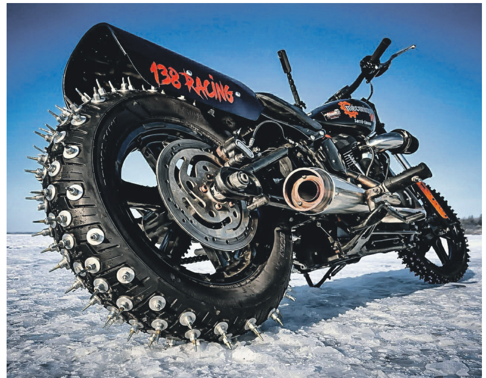
Pour les bons départs, ça prend du bon crampon.

Le champion de drag explique que la Team 138 racing a aussi ses accom-