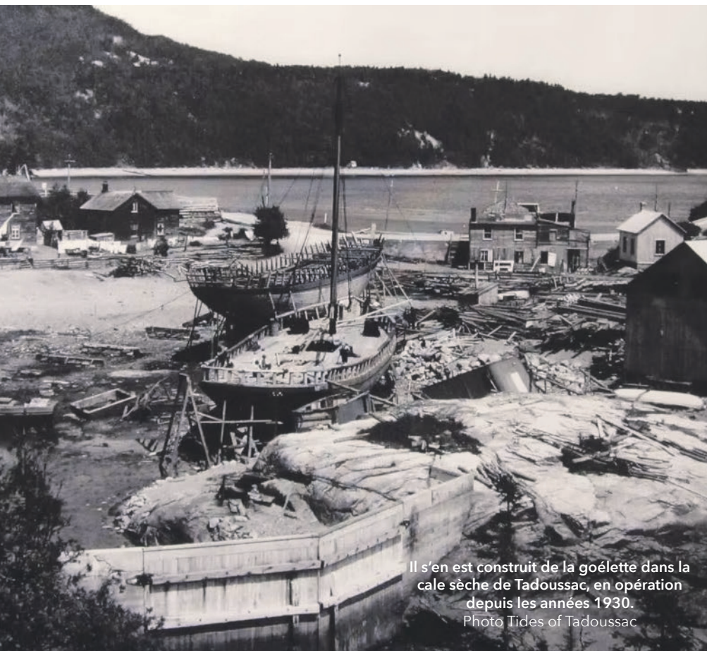
Il s'en est construit de la goëlette dans la cale sèche de Tadoussac, en opération depuis les années 1930.