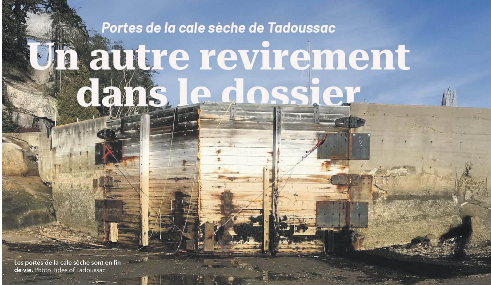
Les portes de la cale sèche sont en fin de vie.