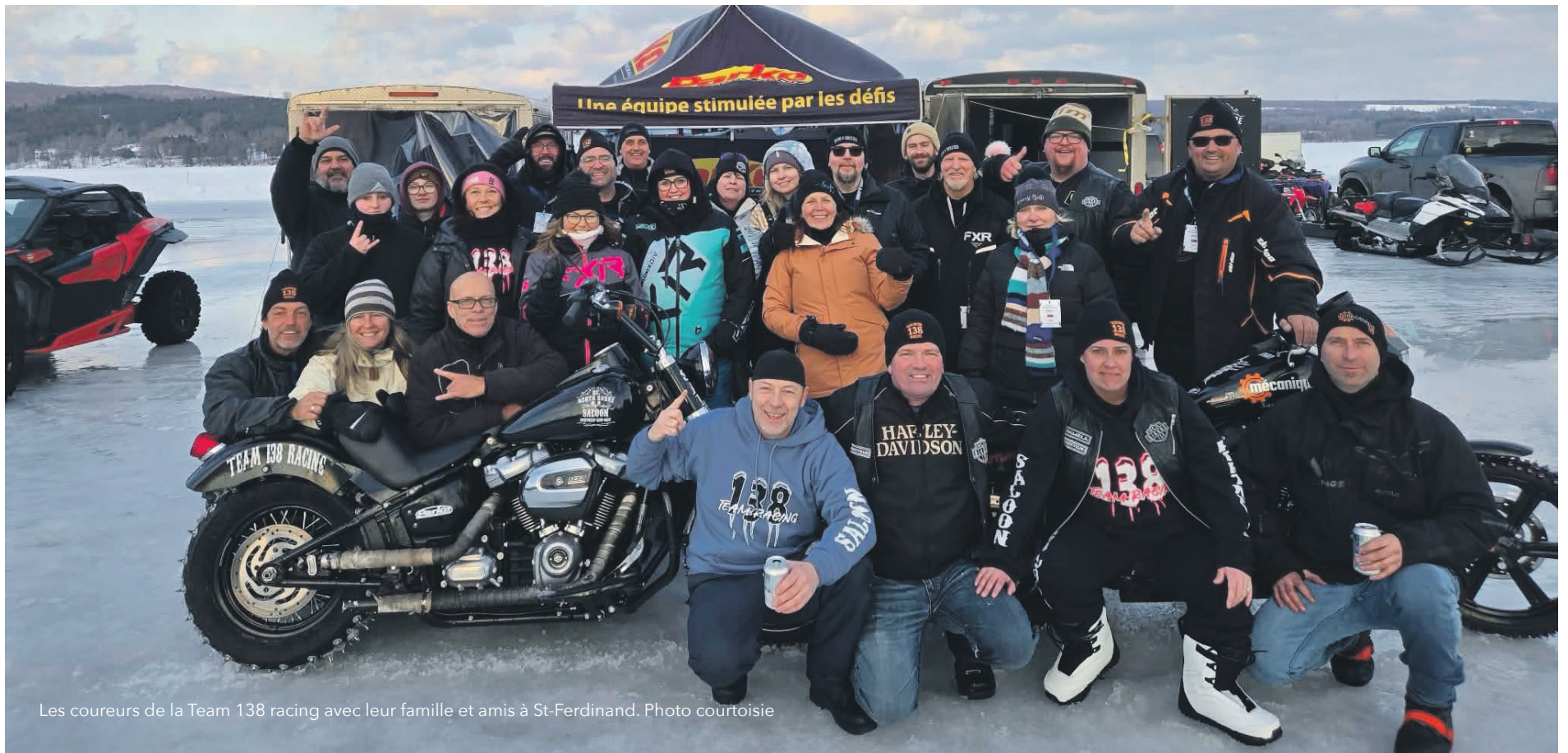
Les coureurs de la Team 138 racing avec leur famille et amis à St-Ferdinand.

toute une expertise pour maîtriser l'art de la drag de moto sur glace, plus particulièrement les départs.