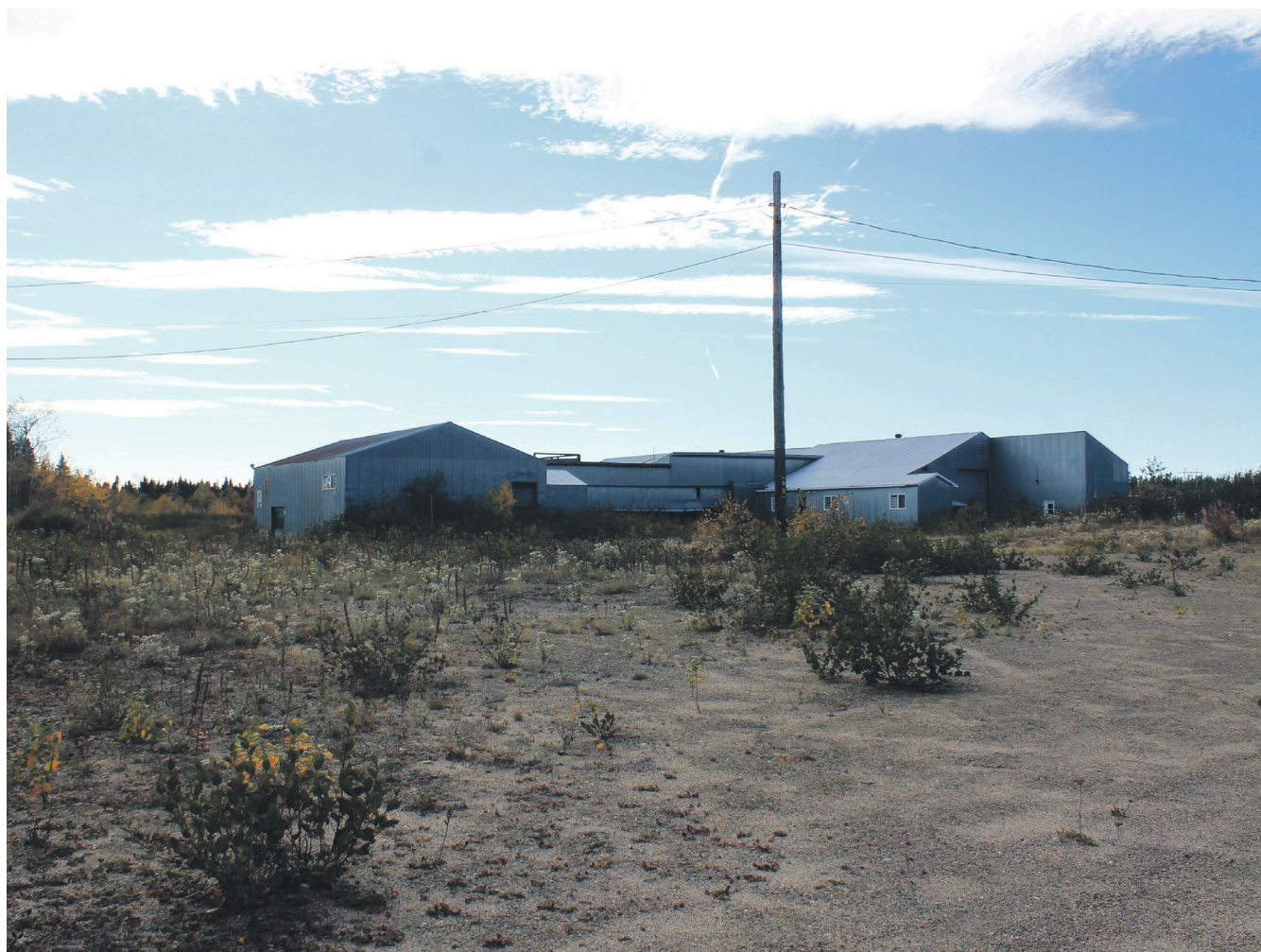
C'est à Baie-Trinité que s'établira le projet de production de saumon AquaBoreal.