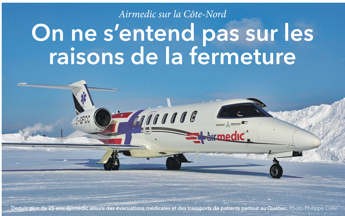
Depuis plus de 25 ans, Airmedic assure des évacuations médicales et des transports de patients partout au Québec.

Québec précise également que la décision de mettre fin au programme hélicoptéré d'Airmedic appartient à l'entreprise, qui opérait ce service à titre de prestataire privé.