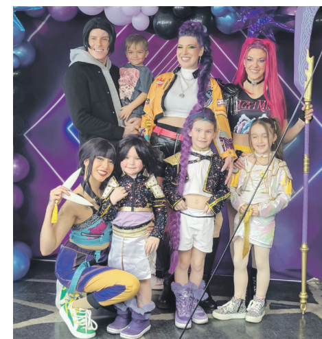
Des centaines d'enfants ont assisté à la représentation des 3 Vibes, présentée devant plus de 900 personnes au Cégep de Jonquière le 28 février.

Bien que le Saguenay-Lac-Saint-Jean l'ait adoptée depuis plus d'une décennie, l'entrepreneure garde un attachement profond à sa région natale. «Forestville, ça reste chez nous», affirme-t-elle, avec l'espoir de voir un jour la même énergie embrasser pleinement la Côte-Nord.