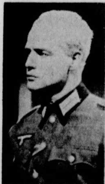
A cinéma et ciné-nuit de samedi le 10 mars, un programme double avec Marlon Brando.