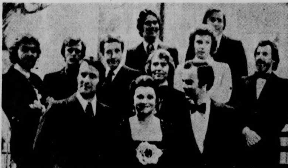
Le gala du plus bel homme du Canada, télévisé en direct à la chaîne française de Radio-Canada le vendredi 16 février à 23 heures, du Théâtre Maisonneuve de la place des Arts, a eu un succès retentissant.