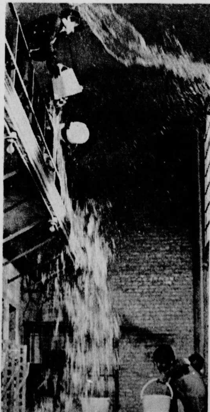
"Aux yeux du sort et des humains" un drame social qui dénonce les problèmes de la vie en prison.