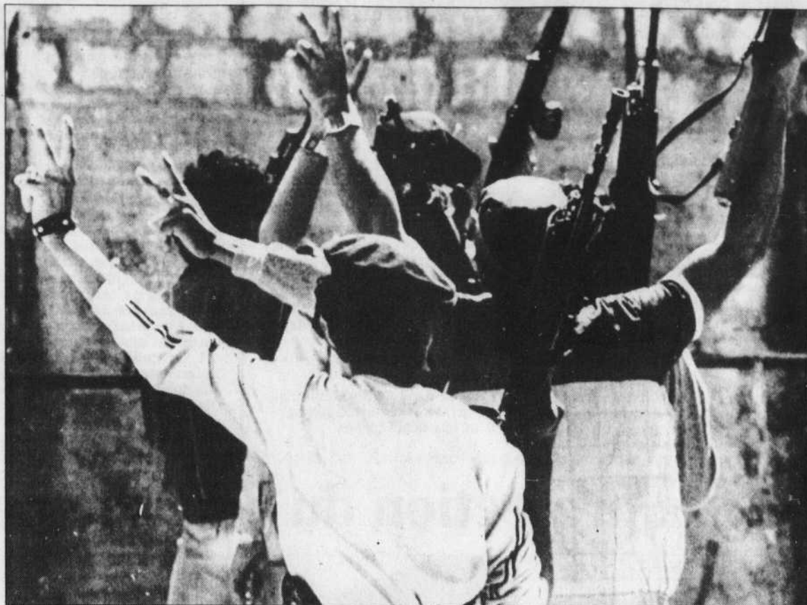
Des guérilleros palestiniens font le « V » de la victoire au camp de réfugiés d'Aïn el-Héloué à Saïda, le chef-lieu du Sud-Liban, où ils combattent des milices chrétiennes depuis trois semaines.

Tancredo Neves était resté député de l'opposition sans interruption pendant les 21 ans du régime militaire, après avoir été pendant 9 mois (1961-62) premier ministre de Joao Goulart, renversé par l'armée en 1964.