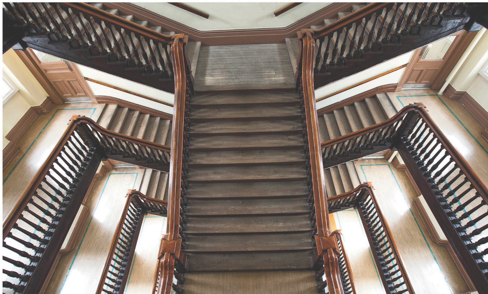
Un des cinq biens patrimoniaux: l'escalier à cage ouverte de John Ostell, qui donne du cinquième étage un vertige en colimaçon.