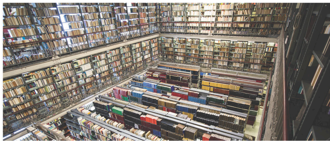
La petite bibliothèque où s'entassent 157 000 volumes, essentiellement en philo, théologie et droit.

Faisons connaître et découvrir l'endroit, déjà, avançait encore M. Froidevaux. D'autant que cinq des éléments architecturaux du Grand Séminaire ont été classés biens patrimoniaux en novembre dernier par le gouvernement du Québec. La très belle Grande Chapelle, qui fête cette année un respectable 110 e anniversaire, est le plus spectaculaire. Le charme naît de la nef dégagée pour permettre les célébrations par réponses,