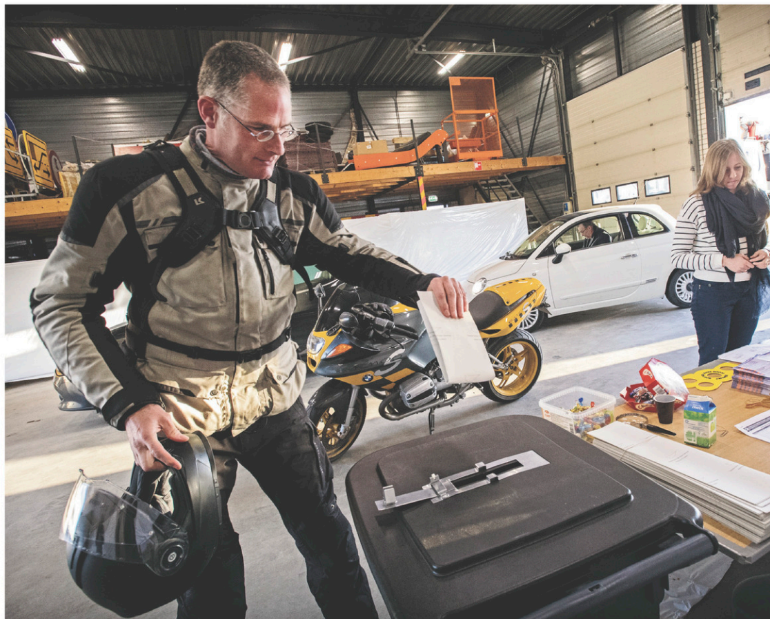
Dans un entrepôt transformé en bureau de scrutin pour l'occasion, un électeur néerlandais a déposé son bulletin de vote dans l'urne.

La victoire centriste souffle aussi le calme centriste sur une Europe surchauffée par la poussée de mouvements politiques populistes, nationalistes ou carrément xénophobes. Le scrutin aux Pays-Bas était souvent décrit par les politologues comme le révélateur des tendances qui pouvaient se développer dans les élections à venir en France et en Allemagne.