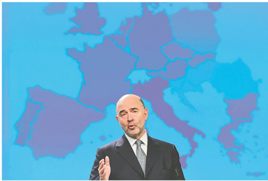
Le commissaire européen, Pierre Moscovici, souhaite notamment des engagements sur une « fiscalité juste et transparente » et « un commerce libre et équitable ».