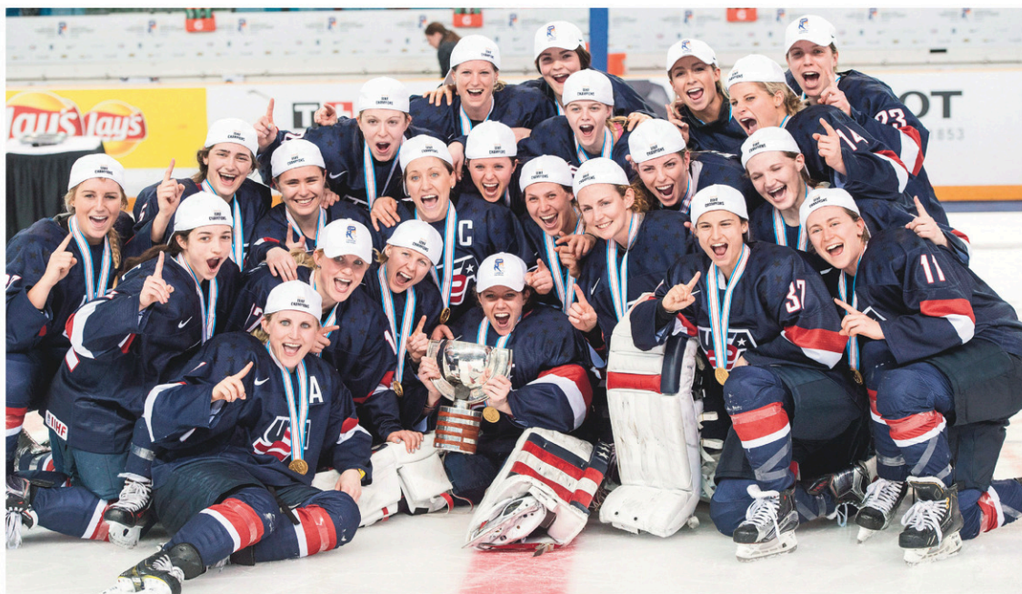
Les patineuses, championnes en titre du championnat mondial de hockey sur glace féminin, souhaitent parapher un contrat avec USA Hockey qui «comprend une compensation adéquate».

Les joueuses n'ont jusqu'ici signé des contrats que lors des années olympiques. Elles souhaitent maintenant obtenir une entente qui couvre les trois autres années du cycle. Selon un communiqué publié