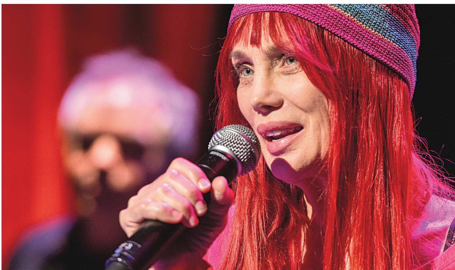
Chloé Sainte-Marie en spectacle