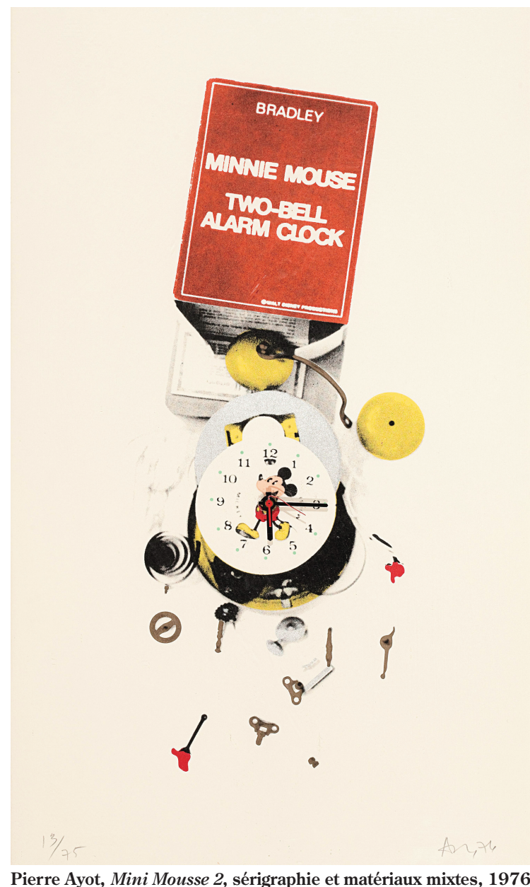
Pierre Ayot, Mini Mousse 2 , sérigraphie et matériaux mixtes, 1976