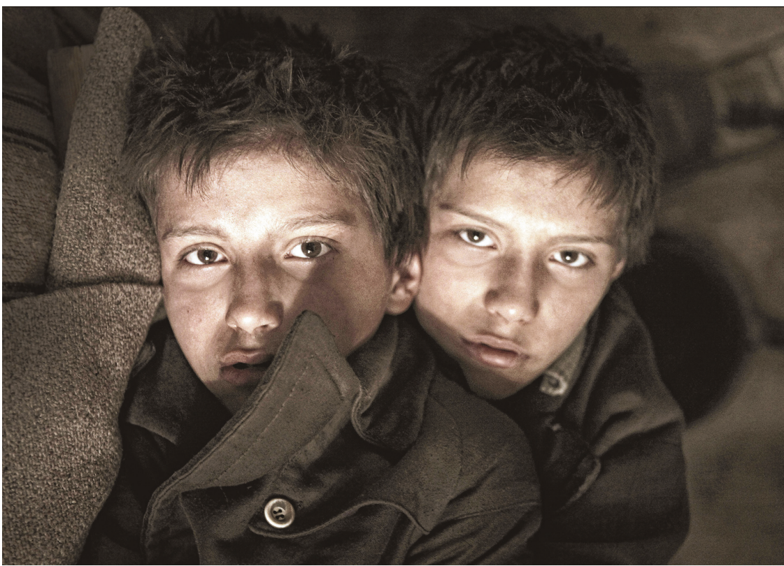
Janos Szasz a mis en images le chef-d'œuvre littéraire qu'est Le grand cahier .