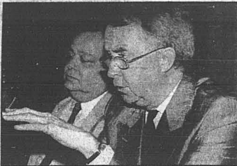
Joe Clark et Shridath Ramphel, secrétaire général du Commonwealth, lors de la conférence de presse qui a clôturé la rencontre de Harare.

« Le comité a noté que ce prêt (qui a financé l'achat de la société minière britannique Consolidated Goldfields par MINORCO) pouvait échapper aux termes stricts de l'embargo sur les prêts