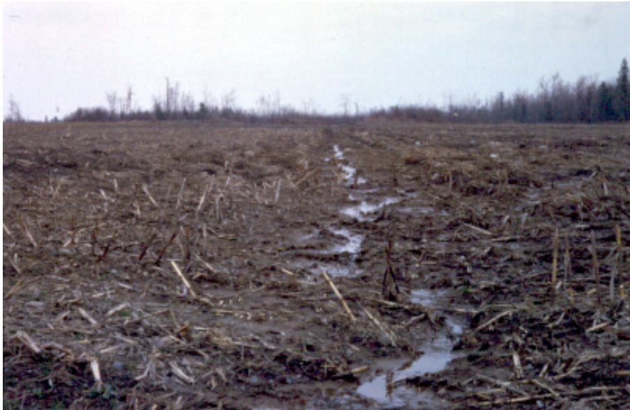
Figure 1. Concentration du ruissellement et érosion hydrique dans un champ

Les processus de ruissellement et d'érosion sont donc sélectifs et déterminent les formes de phosphore entraînées. Plus le ruissellement dispose d'énergie, plus la proportion de phosphore particulaire et la quantité totale de phosphore exportée sont élevées. Alors que l'eau s'infiltré dans le sol, la forme dissoute tend à dominer et la biodisponibilité de l'écoulement souterrain tend à augmenter. Cette tendance est clairement illustrée à figure 2 (exutoire du bassin versant agricole du ruisseau au Castor). La forte proportion du