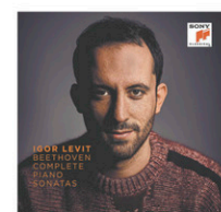
Ludwig van Beethoven Les Sonates pour piano n° 1 à 32 Igor Levit Sony 19075843182

Si l'on ajoute une très belle qualité de présentation, on comprend qu'au-delà de Paul Lewis, au-delà même de Louis Lortie, et (en raison de la concentration permise par la qualité et la précision d'écoute) au-delà de la version Schiff-ECM, Igor Levit nous livre ici la plus déterminante intégrale des Sonates pour piano de Beethoven depuis Stephen Kovacevich au début des années 2000. Kovacevich, dont la somme est disponible en coffret à bas prix ou incluse dans l'intégrale Beethoven Warner, n'a pas eu la chance toutefois d'avoir sur son parcours un ingénieur du son de sa stature.