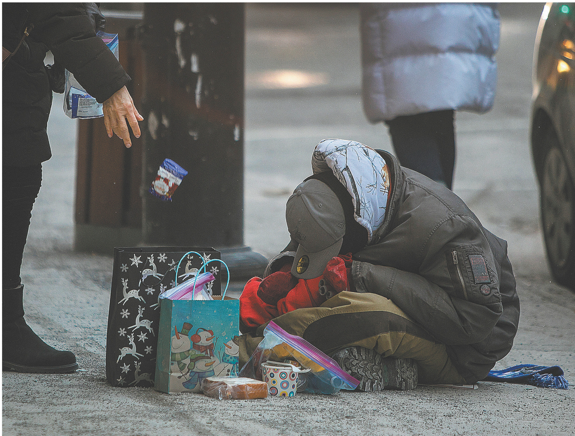
Certains gestes de bonne volonté, comme réveiller un itinérant pour lui offrir à manger, pourraient être mal perçus par les personnes concernées.