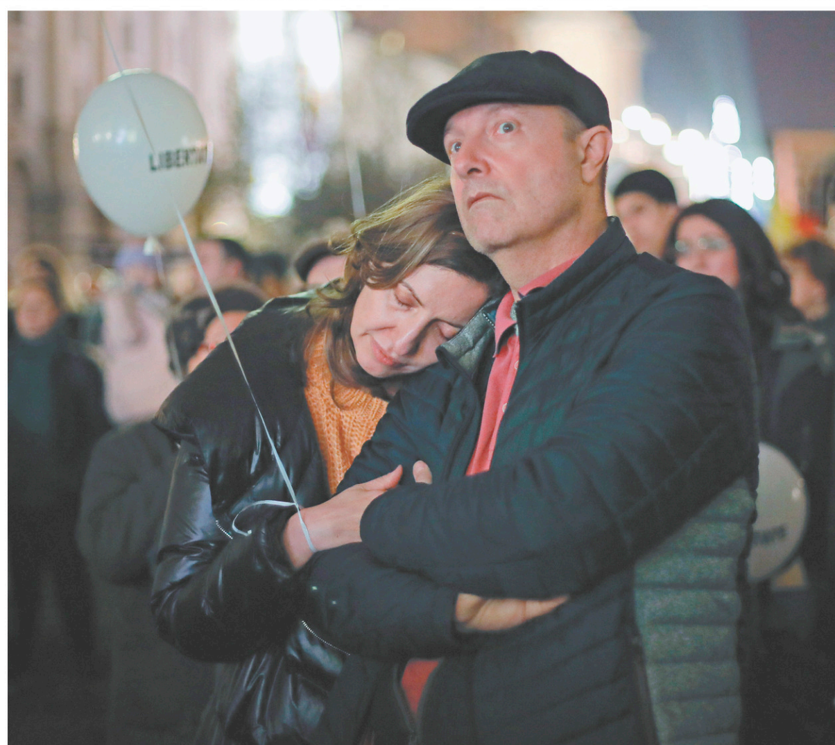
Les manifestants ont observé une minute de silence place de la Révolution avant de laisser s'envoler des centaines de ballons blancs symbolisant, selon les organisateurs, « l'âme des 1142 personnes tuées » il y a trente ans.