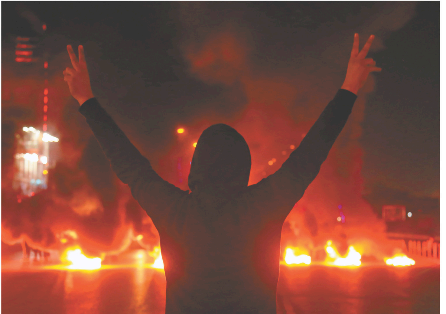
Les manifestants ont dit leur colère dimanche en faisant brûler des pneus en travers d'autoroutes ou d'avenues des centres-villes.

François Brousseau est chroniqueur d'affaires internationales à Ici Radio-Canada. Cette chronique fait relâche jusqu'au 13 janvier 2020.