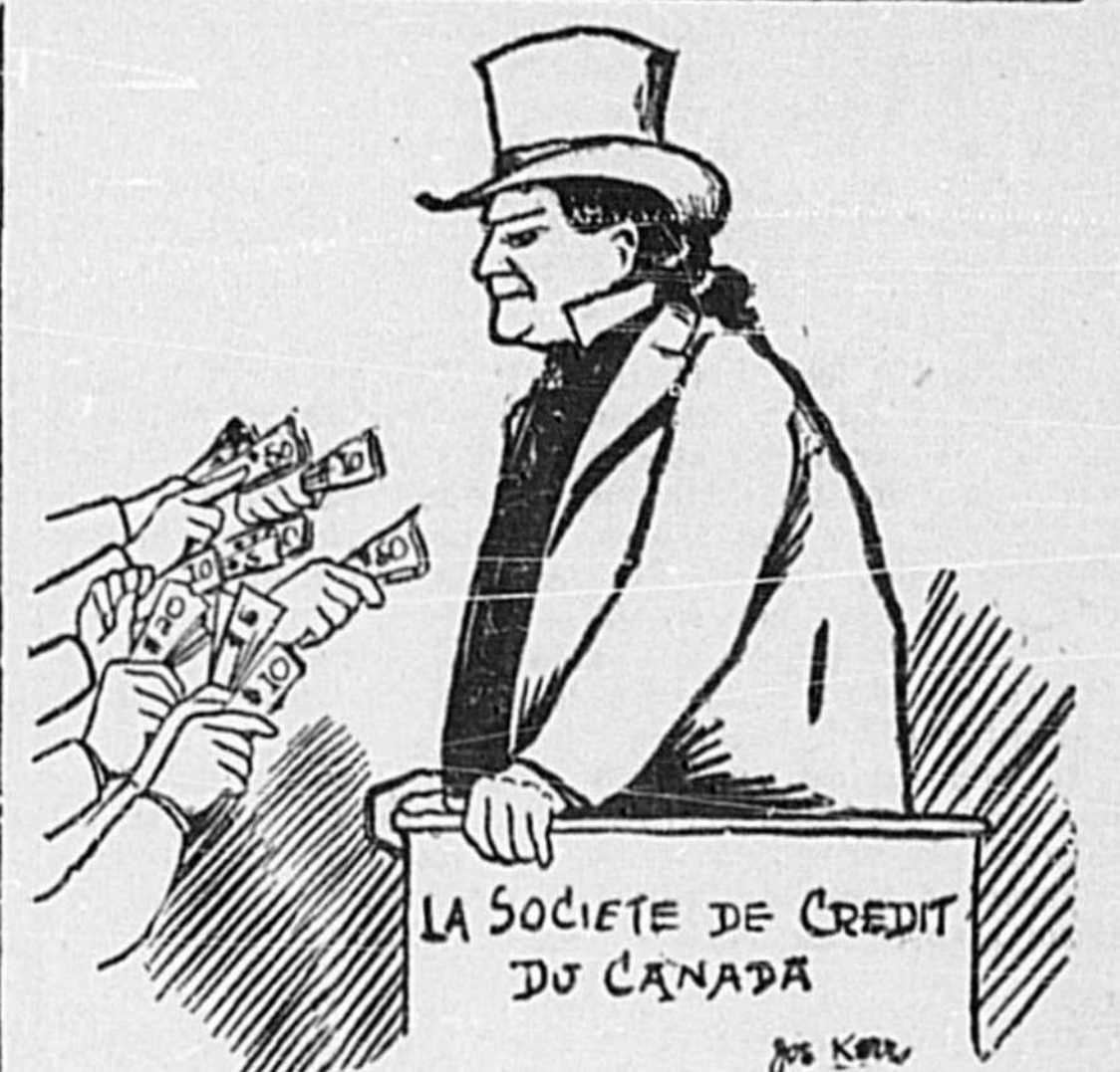
— Oui, messieurs, je vous donne 3 piastres pour une, et si je voulais, je vous en donnerais 10 pour une, mais... je ne veux pas.

La situation à Québec ne présentera pas de nouveaux développements tant que M. Parent n'aura pas réussi à bloquer sûrement M. Turgeon. Il y a trois semaines, M. Archambault a failli devenir premier ministre; à la dernière minute ses parrains lui ont fait défaut, et plutôt que de céder la place à M. Turgeon, M. Parent est resté. Mais on peut être sûr que le départ de M. Parent est résolu. On en veut plus que jamais pour la construction du G.-T.P., depuis que la commission de colonisation a déclaré, bien à contre cœur il est vrai, que son fameux talent administratif n'a réussi qu'à