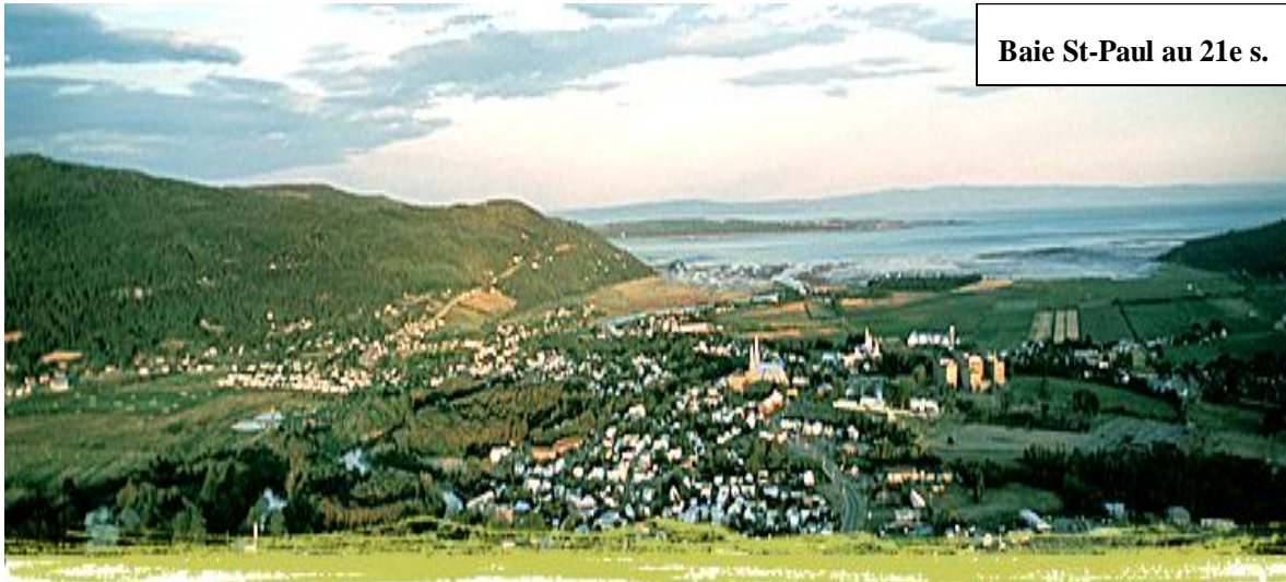
Baie St-Paul au 21e s.