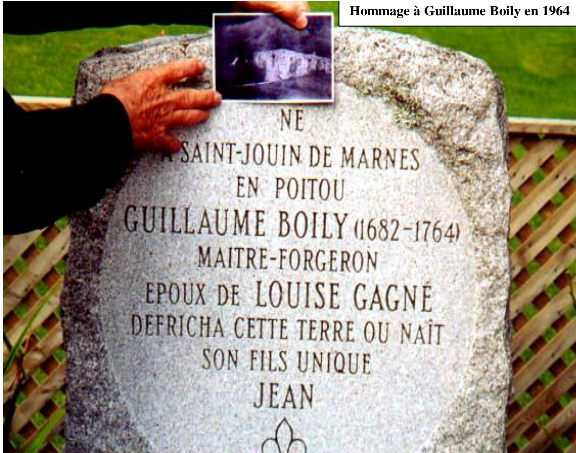
Hommage à Guillaume Boily en 1964