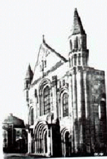
1) Façade de l'église abbatiale de Saint-Jouin de Marnes. Cette église est de style gothique et son architecture est remarquable. Elle est située dans le village de Saint-Jouin de Marnes, à l'ouest de Bordeaux. Elle a été construite au XIII e siècle et a subi de nombreuses modifications au cours des siècles suivants. Elle est classée monument historique depuis le 10 mai 1906. La façade est particulièrement remarquable.