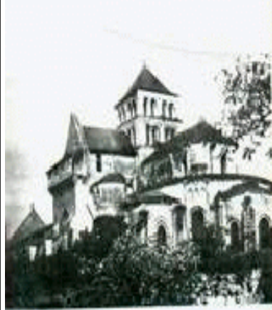
2) Façade de l'église de Saint-Jouin de Marnes. Cette église est de style gothique et son architecture est remarquable. Elle est située dans le village de Saint-Jouin de Marnes, à l'ouest de Bordeaux. Elle a été construite au XIII e siècle et a subi de nombreuses modifications au cours des siècles suivants. Elle est classée monument historique depuis le 10 mai 1906. La façade est particulièrement remarquable.

Ci-contre, église abbatiale de Saint-Jouin au 11 e siècle.