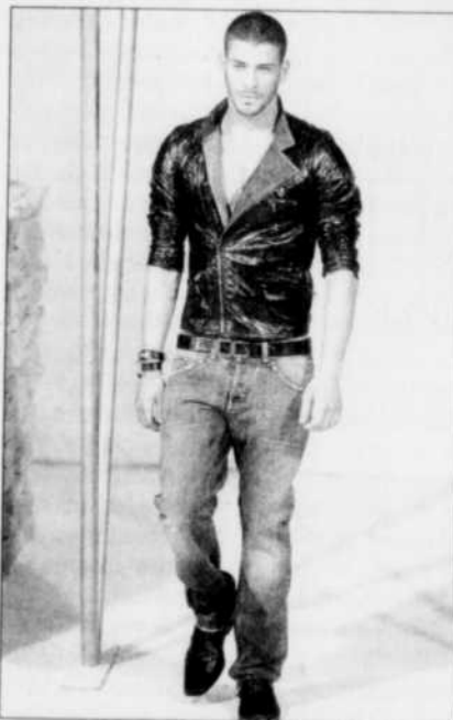
Sortez le rocker en vous...

Trucs : La veste militaire est une excellente solu-