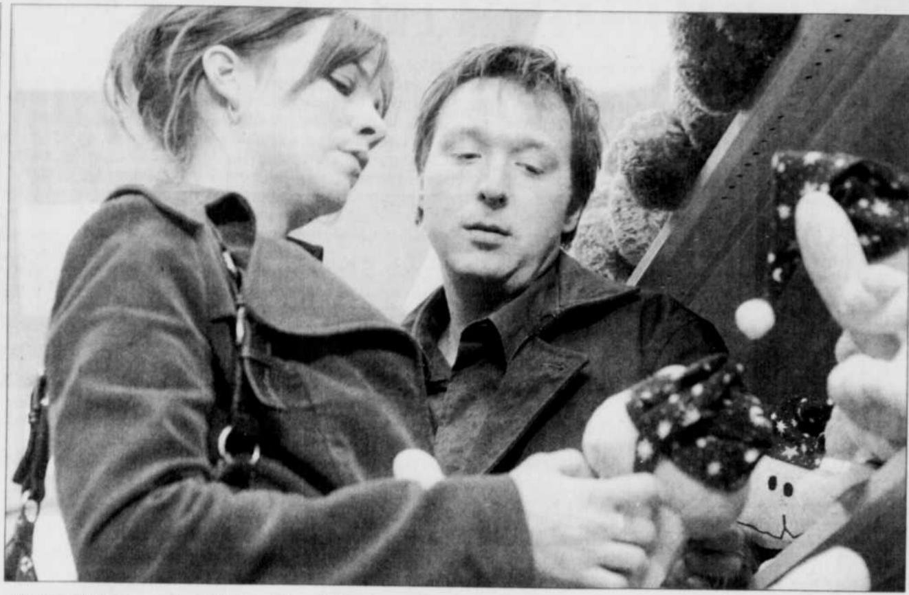
«Horloge biologique» du réalisateur Ricardo Trogi est présenté dans les cinémas suivants: Cinéplex Odéon Beauport, Charest et Sainte-Foy, Clap, Des Chutes, Galeries de la Capitale et Lido.

CINÉPLEX ODÉON SAINTE-FOY (871-1550). Familia (2) v.l. 13h, 15h20, 19h25, 21h55 (13 ans). Just Like Heaven (1) v.o.a. 12h25, 14h40, 16h50, 19h20, 21h30 (G). Seigneur de guerre (1) 12h30, 15h35, 19h05, 21h50 (13 ans). Crier au loup (1 1/2) 12h55, 15h05, 17h10, 19h30, 21h40 (13 ans). The Exorcism of Emily Rose (3) v.o.a. 12h50, 15h30, 18h55, 22h (13 ans). Le transporteur 2 (2) 13h20, 15h, 18h20, 21h15 (13 ans). La marche de l'empereur (4) 13h30, 15h55, 18h30, 21h (G). La constance du jardinier (3) 12h45, 15h40, 18h50, 21h45 (G). 40 ans et encore puceau (2 1/2) 12h35, 16h10, 18h35, 21h10 (13 ans). Vol sous haute pression (1 1/2) 13h10, 15h15, 19h15, 21h20 (13 ans). Horloge biologique (3) 13h05, 13h25, 15h25, 15h50, 18h45, 19h10, 21h05, 21h25 (13 ans). L'île (3) 12h40, 15h45, 18h40, 21h35 (G). Garçons sans honneur (2) 13h15, 16h, 19h, 21h40 (13 ans). Tarifs: Soir: adultes 12$, enfants et aînés: 6,25$. Sam. dim. avant 18h: adultes 9,50$, enfants et aînés: 6,25$. Lun. au ven. avant 18h, et mar. merc. toute la journée: adultes 7,50$, enfants et aînés: 6,25$, sauf les jours fériés.