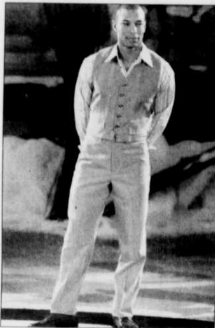
Le gilet est de nouveau à la mode.

en tapisserie ou encore celui aux motifs abstraits que l'on portait jadis. Il s'en fait maintenant de bien plus beaux !