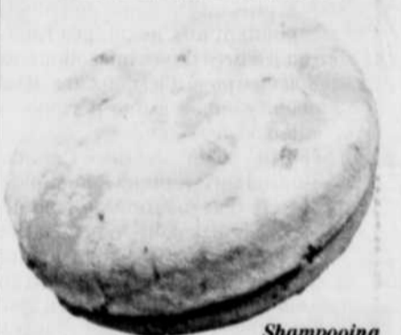
Shampooing en barre de Lush