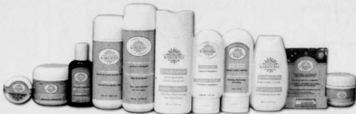
Kariderm est une gamme de produits cosmétiques naturels à base de beurre de karité biologique conçue au Québec.

828, avenue Myrand, Sainte-Foy Grand stationnement 681-0249