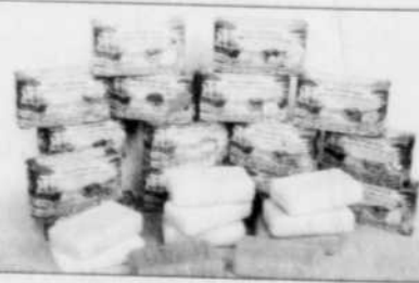
Le savon des Antilles

On trouve les produits Kariderm dans les magasins de produits naturels. Pour connaître la liste, composer le numéro sans frais 1 877 527-4838.