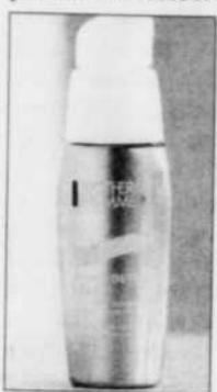
Soin hydratant oxygénant anti-teint terne, Hydra Detox 32 $

Sothys Homme présente le soin Antifatigue pour les yeux, un gel crème anticernes, antipoches et antirides qui redonne de la tonicité et lisse le contour des yeux. La gamme de soin pour homme Sothys contient un extrait de malt, que la compagnie appelle Phytomalt, destiné à apaiser les peaux sensibles. Le malt qui provient