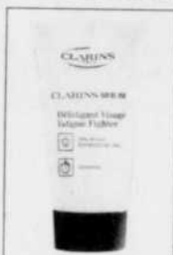
Défatigant visage, Clarinsmen, 32 $

de nos grandes villes, précisez-t-on. En formule améliorée, le soin hydratant contient un booster d'oxygène qui apporte et diffuse de l'oxygène à la surface de la peau, clarifiant ainsi le teint. Pour un coup d'éclat instantané au visage, pour les lendemains de veille ou pour la fatigue causée par les décalages horaires, Clarins pour homme propose le gel crème Défatigant visage. L'extrait de l'arbutose gaulthérie, détoxifie et éclaircit la peau tandis que les auxines de tournesol — une hormone végétale — retendent les traits fatigués tout en hydratant et en protégeant la peau de la pollution.