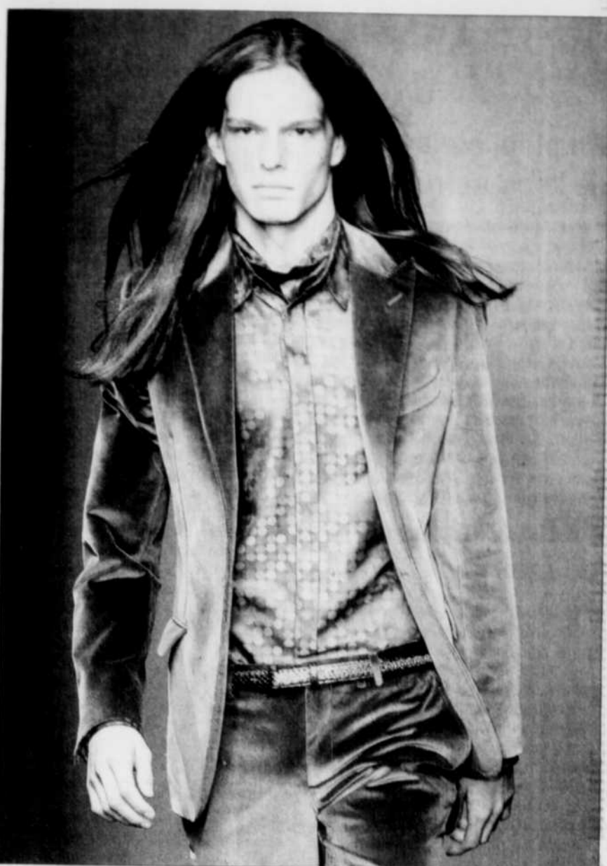
La veste de velours est l'élément-clé de l'automne.

tion de rechange au veston parfois trop classique. Idéal pour créer un look décontracté.