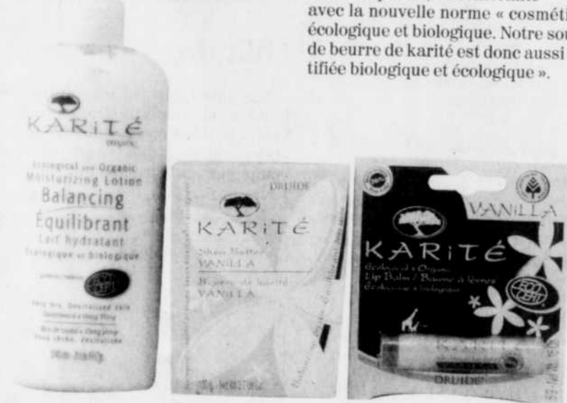
La ligne au beurre de karité de Druide est vaste.