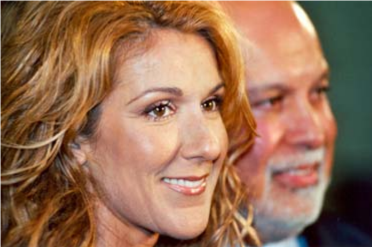
Céline Dion et René Angélil