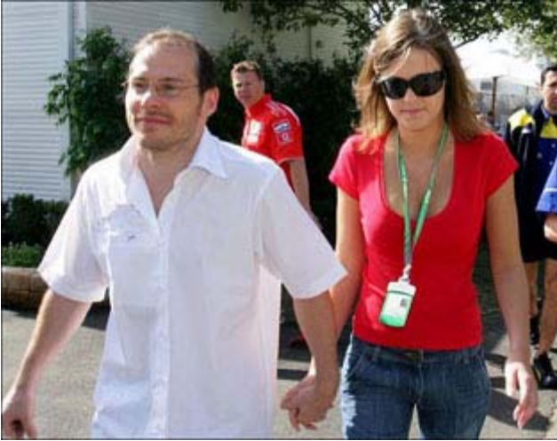
Jacques Villeneuve et

La fièvre du Grand Prix survole Montréal le temps d'un week-end. Plusieurs activités sont à l'agenda: Jacques Villeneuve dévoile son disque; Christian Tortora publie son livre autobiographique et la piste Gilles-Villeneuve reçoit des milliers d'amateurs de courses automobiles. Le Grand Prix F1 du Canada est un des événements qui rapportent beaucoup à Montréal au plan des retombées économiques et médiatiques. On a évalué qu'un riche visiteur étranger peut dépenser jusqu'à 60 000$ durant les trois jours (jet, hôtel, restaurants et paddock). Le livre d'anecdotes de Tortora est un excellent compagnon pour ce week-end et à posséder dans sa bibliothèque! Des photos du lancement sur le site Internet.