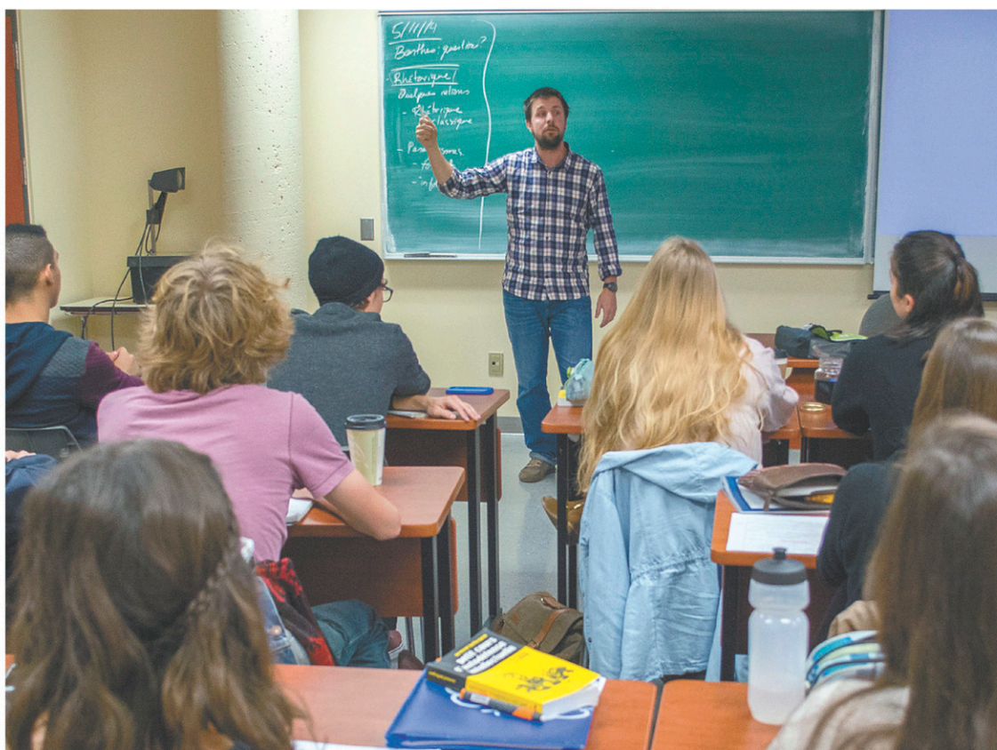
Deux millions de diplômés sont sortis des cégeps depuis leur création en 1967.

Ce bilan indique aussi que deux millions de diplômés sont sortis des cégeps depuis leur création et que le Québec s'est hissé au premier rang au Canada en matière d'obtention d'un diplôme postsecondaire : 50 % de nos jeunes détiennent un tel diplôme, contre 29,9 % en Ontario, soit la province à laquelle les au-