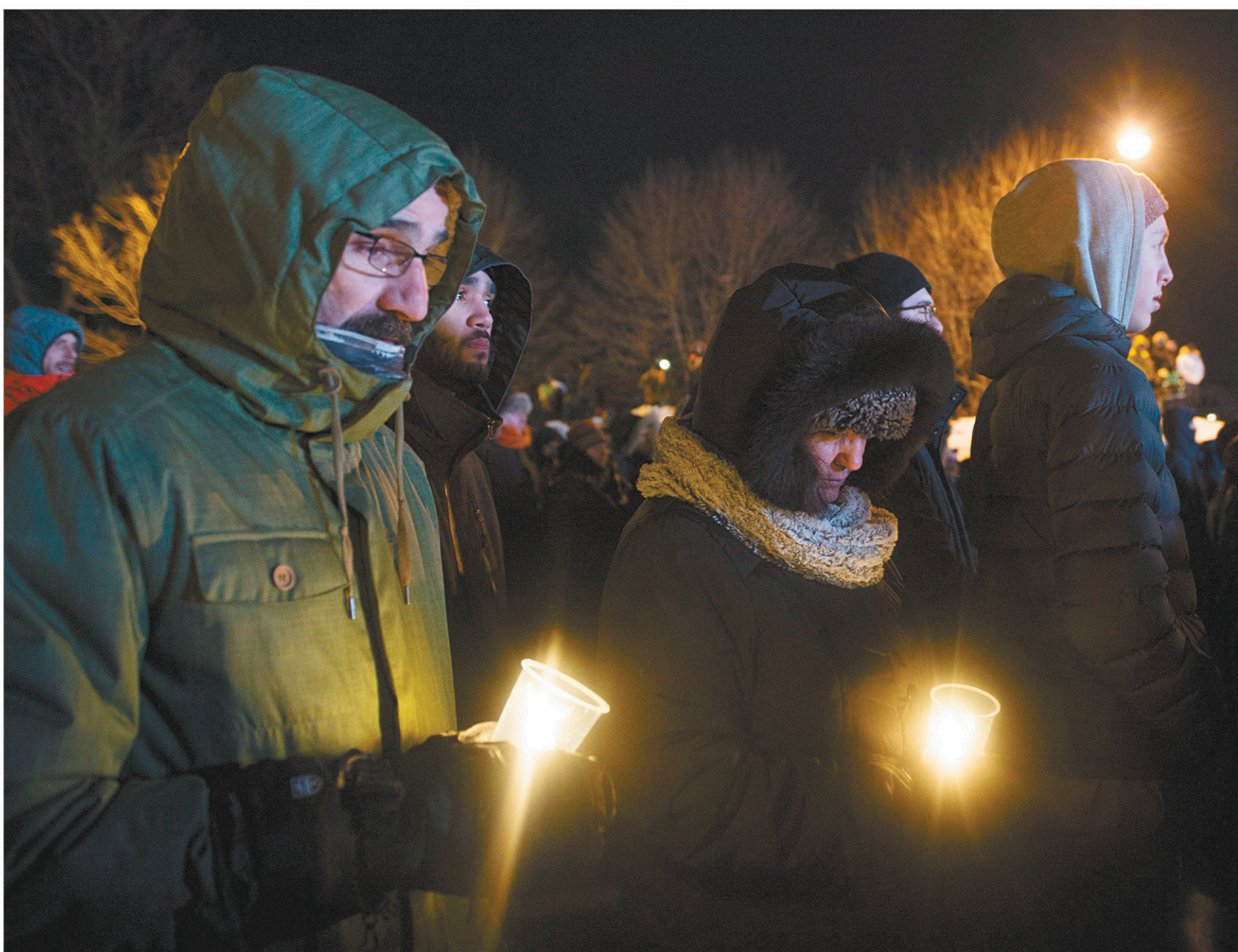
Des centaines des personnes ont bravé le froid dans la Vieille Capitale lundi soir pour prendre part à une veillée en hommage aux victimes de l'attentat de la grande mosquée de Québec.