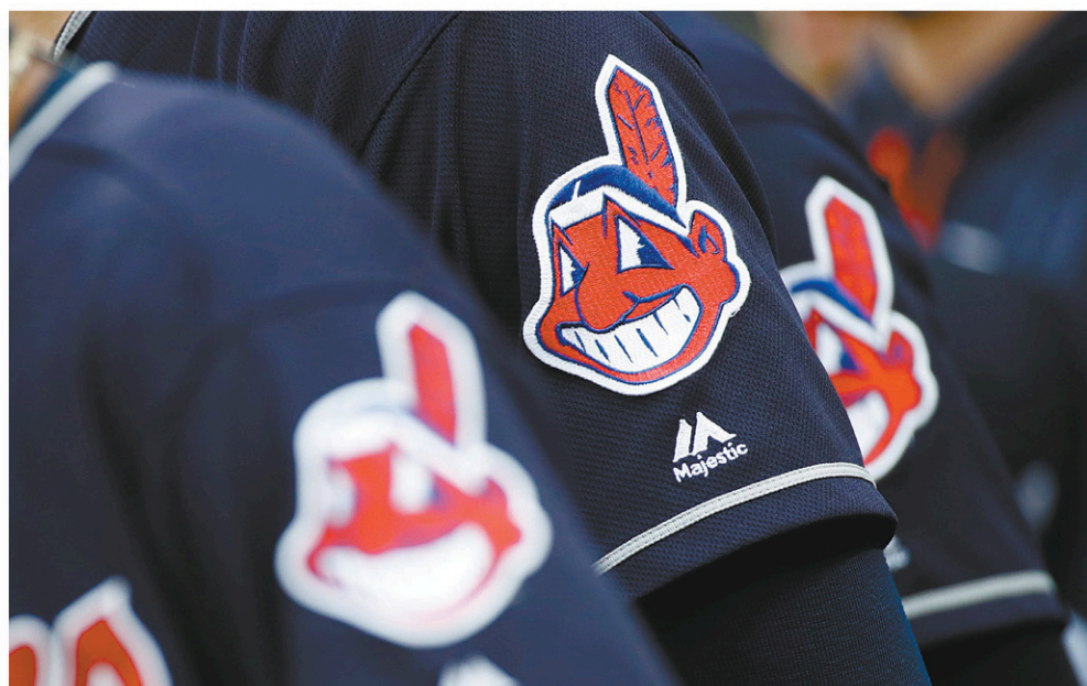
La célèbre figure du chef Wahoo disparaîtra des uniformes des Indiens de Cleveland à compter de la saison 2019. L'équipe fondée en 1900 conservera cependant son nom.

Le Plain Dealer , quotidien de Cleveland qui avait inventé le logo dans les années 1915, a pris position pour son retrait cent