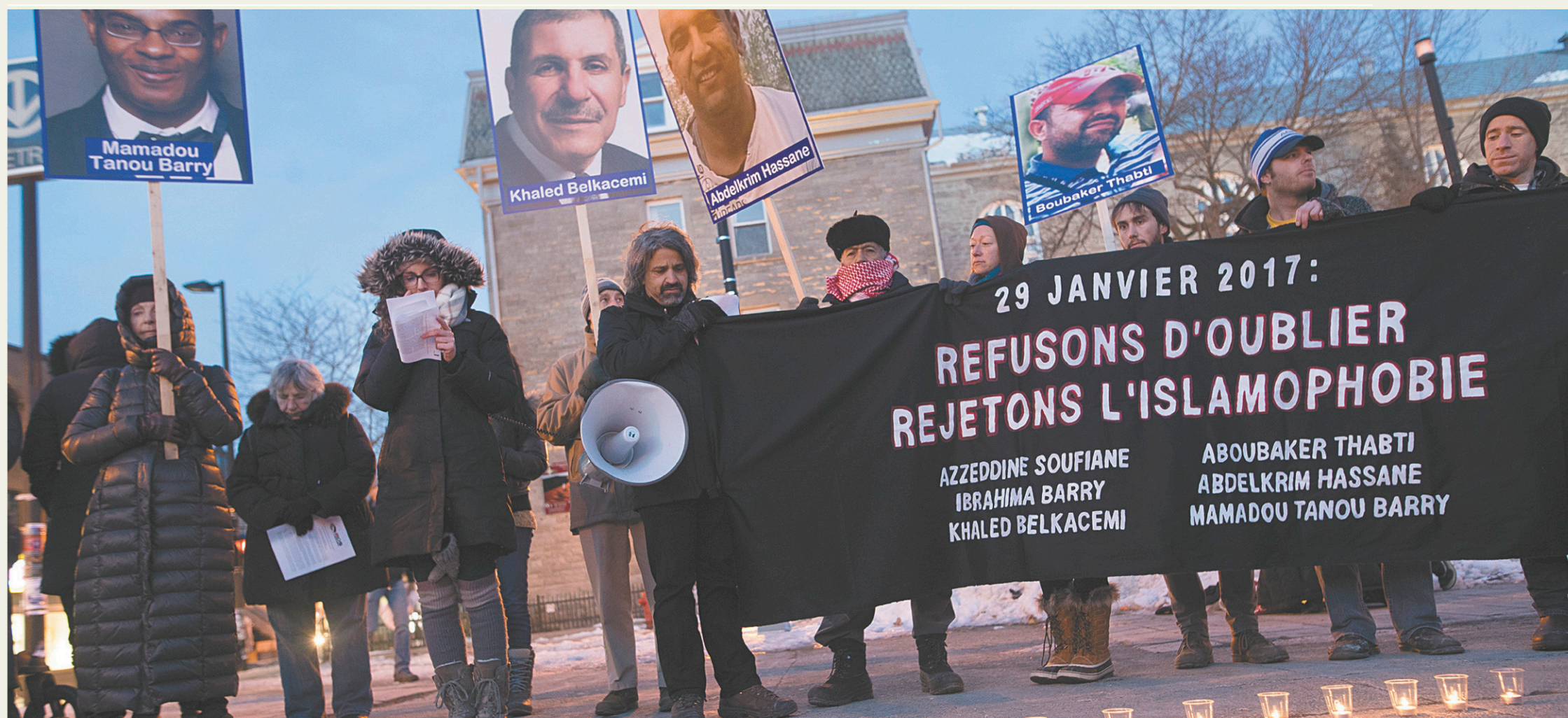
Une centaine de personnes se sont réunies devant la station de métro Mont-Royal, à Montréal, en souvenir des victimes de l'attentat de Québec.

EN IMAGES, LE TRISTE ANNIVERSAIRE DE L'ATTENTAT DE LA MOSQUÉE DE QUÉBEC