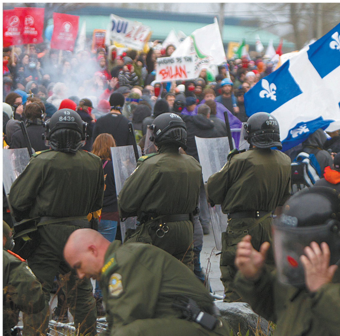
Des manifestants s'étaient rendus à Victoriaville entre le 4 et le 6 mai 2012 pour protester contre la hausse des frais de scolarité décrétée par Québec.