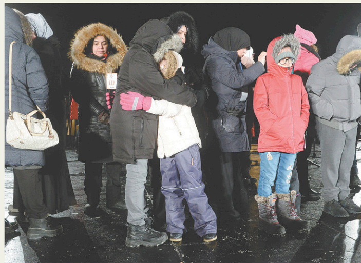
Des proches des victimes s'enlacent lors de la soirée commémorative à Québec.