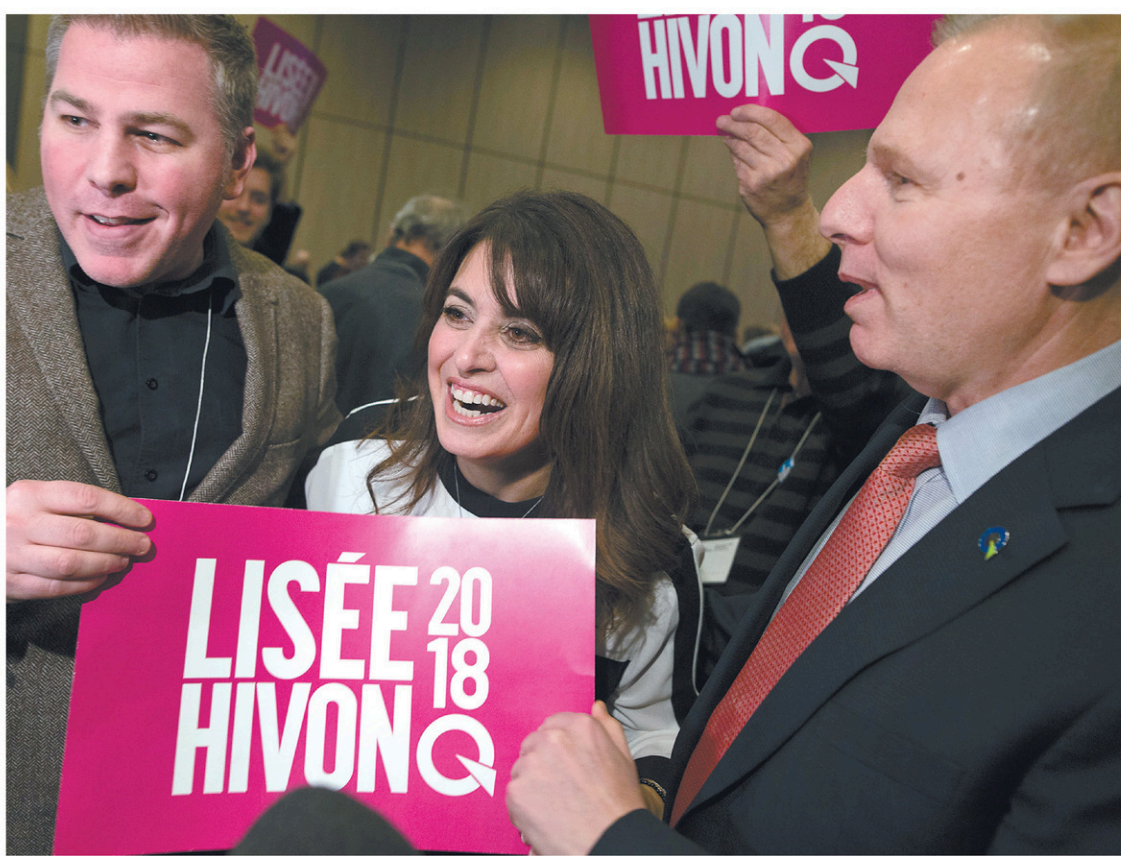
Au PLQ comme à la CAQ, on convient que l'élue de Joliette projette une image consensuelle comme aucun autre acteur de la scène politique.