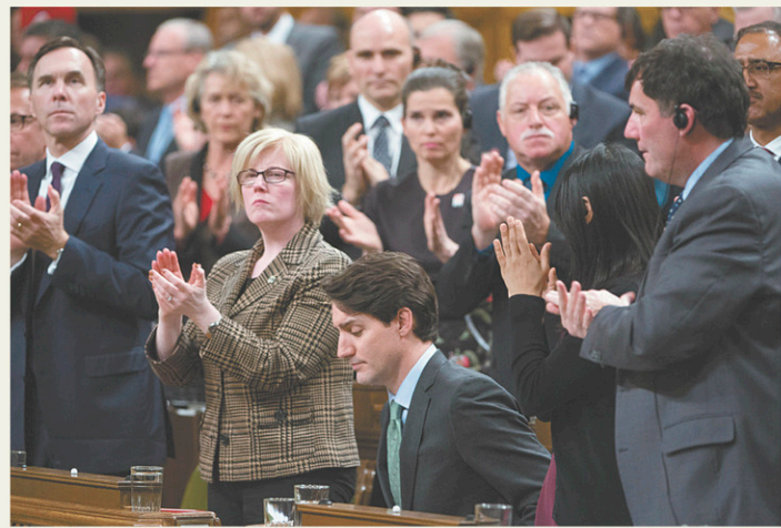
Dans une allocution à la Chambre des communes, Justin Trudeau a exhorté tous les Canadiens à se dresser « contre l'islamophobie et contre toute forme de discrimination ».