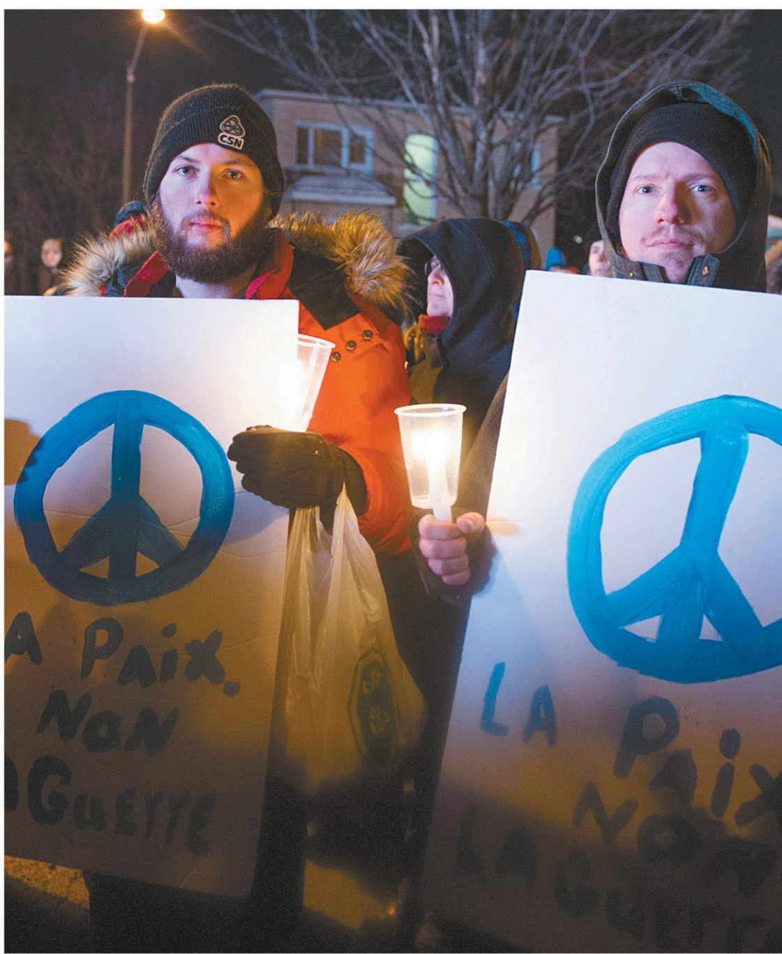
Des participants à la veillée ont profité du rassemblement pour propager un message de paix et de tolérance.

Les organisateurs avaient aussi invité Nathalie Provost, survivante de la tuerie de Polytechnique, en 1989. «Je suis frappée par les nombreuses similarités qui nous rapprochent», a-t-elle dit en soulignant l'esprit de solidarité et de dignité des représentants des familles et du Centre culturel islamique de Québec. «Je suis chavirée parce que vous avez raconté, par-