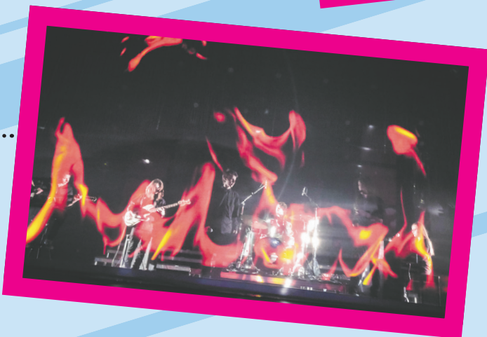
..... Spectacle multimédias « Comme un sage » d'Harmonium par les élèves de l'école secondaire Mitchell- Montcalm, sous la direction de l'enseignante Ginette Souchereau.