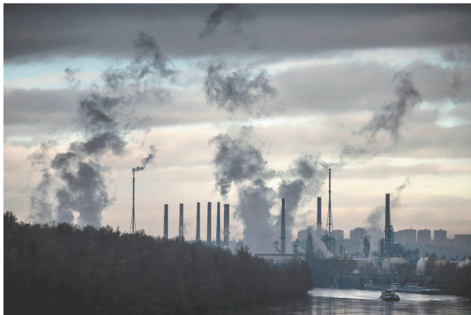
La Banque européenne (BEI) estime que sa politique d'investissement se conforme aux engagements de l'Accord de Paris sur les réductions d'émissions de gaz à effet de serre.