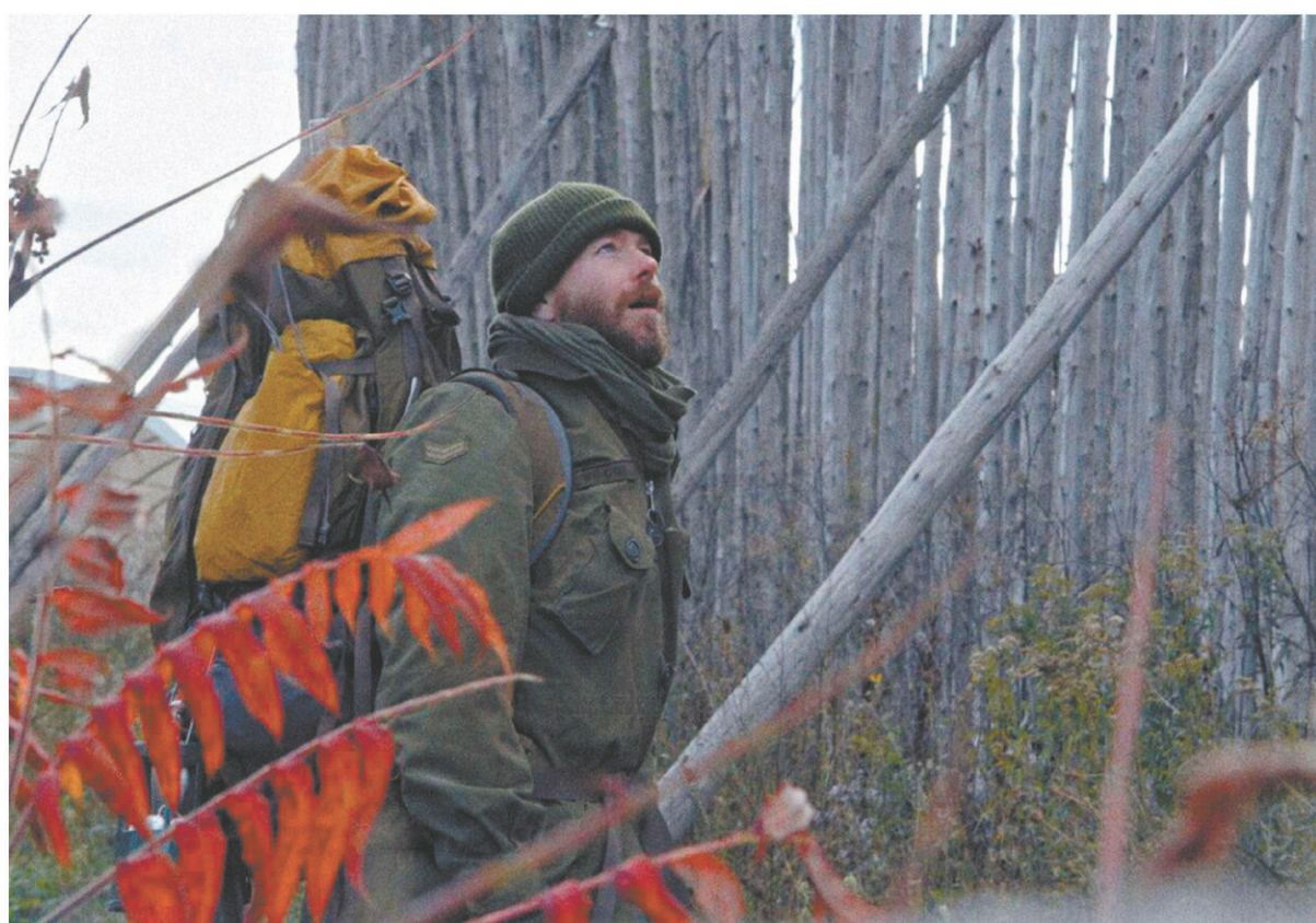
Une scène de Wilcox , le dernier film du réalisateur Denis Côté (photo du haut).