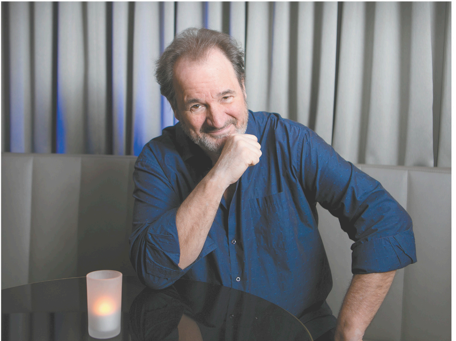
Les 42 spectacles qui célébraient les 40 ans de carrière de Paul Piché ont touché 75 000 personnes.