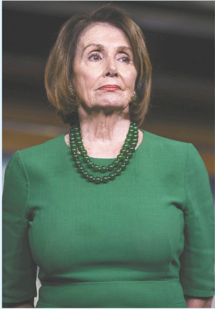
La présidente de la Chambre des représentants, Nancy Pelosi