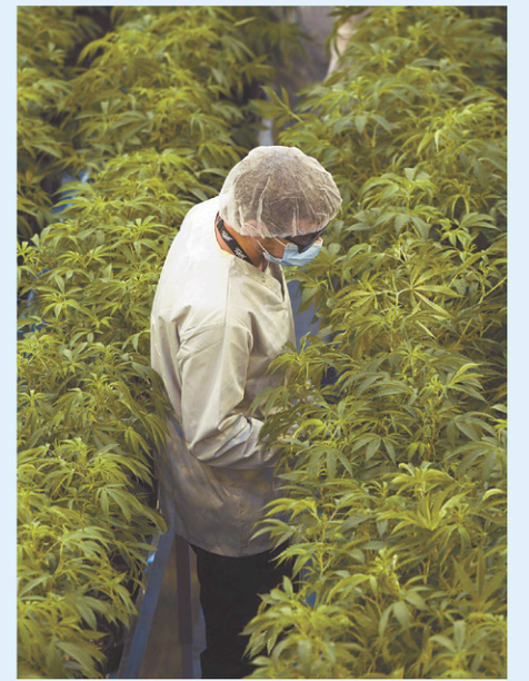
Le producteur de cannabis canadien Canopy Growth a affiché une lourde perte pour son plus récent trimestre.