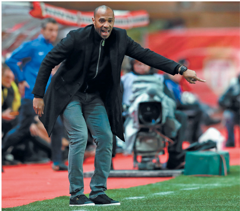
L'Impact a retenu les services de l'ancien joueur de soccer international français, Thierry Henry, avec une entente de deux ans, assortie d'une option pour 2022.