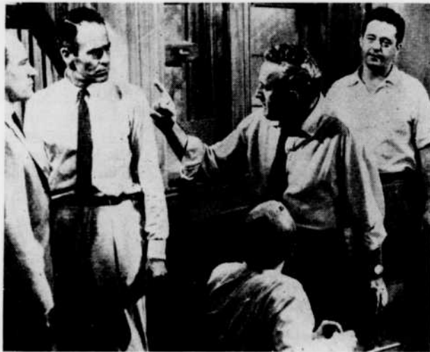
« Douze hommes en colère »