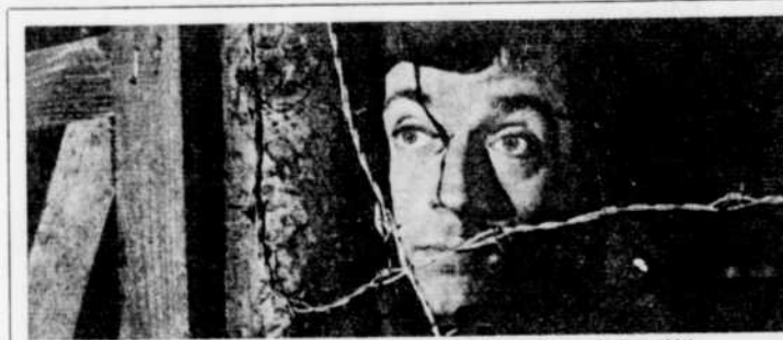
Au "Festival Jean Renoir", mardi à 11 heures, "Le Caporal épinglé".