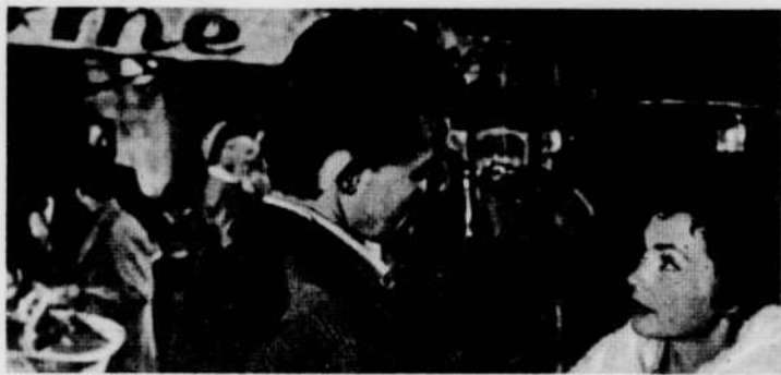
« Montparnasse »