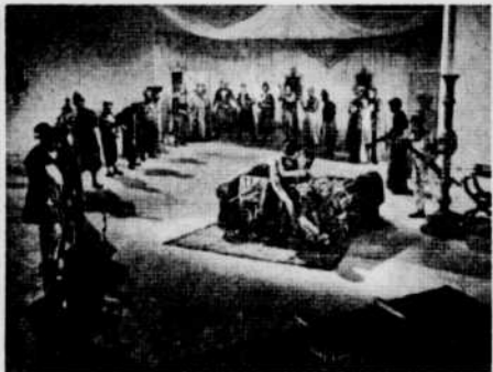
« Les Belles de nuit »