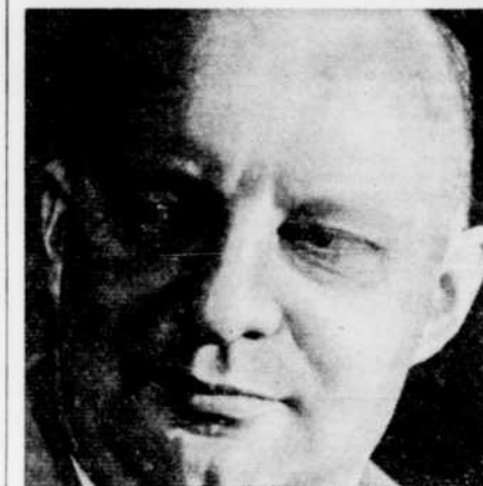
A l'émission "Nocturne", à 12 h. 02, Hindemith.