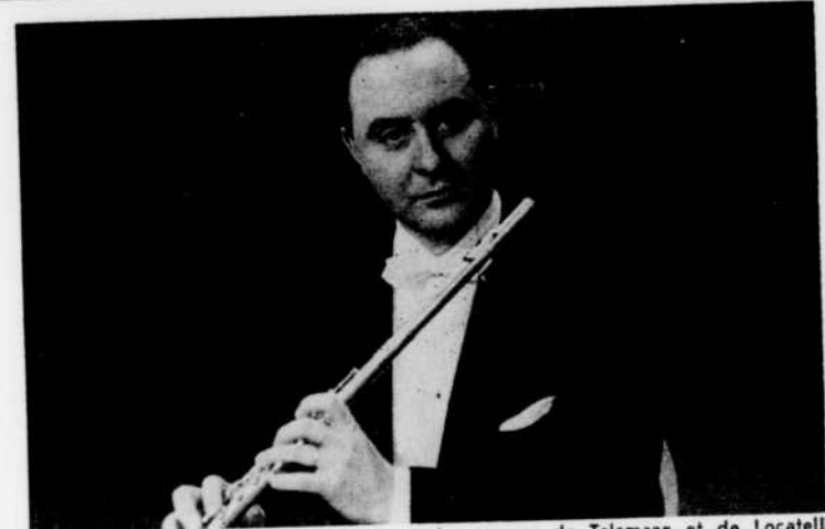
Jean-Pierre Rampal, flûtiste, interprétera des oeuvres de Telemann et de Locatelli à l'émission "Ad lib", à 4 h. 45.