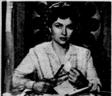
« Porte des Lilas »