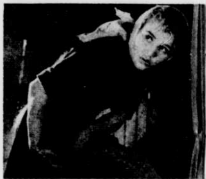
« La Ballade du soldat »