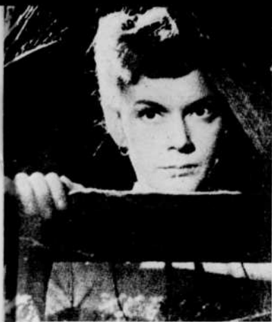
« Mademoiselle Julie »