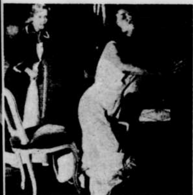
« Une vie »