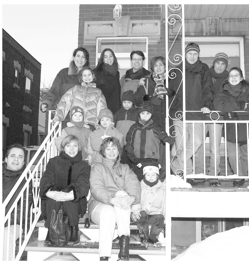
Les « garderies à 5 $ » constituent le fleuron des dernières années en économie sociale, même si elles sont décriées par les parents qui demeurent sur les listes d'attente. Ci-haut, des enfants et des parents devant les locaux de la garderie Coccinelles chéries.

Pour les libéraux, 50 000 places encore manquantes dans le réseau des garderies, c'est à la fois « injuste » et le reflet que « le gouvernement est incapable de répondre à un besoin qu'il a créé de toutes pièces ». Le Parti libéral entend maintenir les services de garde à 5 $ et ajouter 50 000 places dans les CPE et les garderies privées. Il s'engage « dès le 1 er septembre 2003 » à autoriser l'ouverture de 3000 places dans les garderies privées existantes et à reconnaître et financer les haltes-garderies communautaires. Le PLQ prévoit financer ces mesures en récupérant les 210 millions en cinq ans promis par Ottawa pour le développement