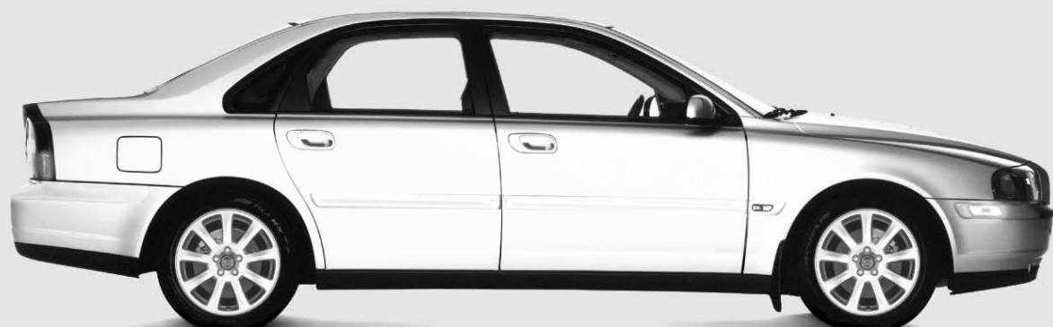
S80 2.9 SR - CARACTÉRISTIQUES DE SÉRIE

BOÎTE DE VITESSE MANUELLE À 5 RAPPORTS • RÉGULATEUR DE STABILITÉ ET DE TRACTION • ROUES EN ALLIAGE • MOTEUR DE 168 CH • RIDEAUX GONFLABLES LATÉRAUX • SIÈGES AVEC SYSTÈME DE PROTECTION ANTICONTRECOUP • SIÈGES CHAUFFANTS À DEUX RÉGLAGES • DÉVERROUILLAGE DES PORTES TÉLÉCOMMANDÉ • CHAÎNE STÉRÉO HAUT DE GAMME AVEC LECTEUR CD ENCASTRÉ