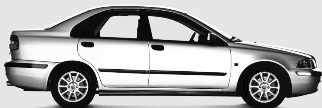
S40 1.9T - CARACTÉRISTIQUES DE SÉRIE

ENFIN UN DÉPÔT DE GARANTIE QUI VOUS GARANTIT VRAIMENT QUELQUE CHOSE.