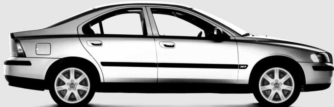
S60 2.4 - CARACTÉRISTIQUES DE SÉRIE

BOÎTE DE VITESSES AUTOMATIQUE À 5 RAPPORTS • ROUES EN ALLIAGE • MOTEUR DE 170 CH • RIDEAUX GONFLABLES LATÉRAUX • SIÈGES AVEC SYSTÈME DE PROTECTION ANTICONTRECOUP • DÉVERROUILLAGE DES PORTES TÉLÉCOMMANDÉ • LECTEUR CD ENCASTRÉ