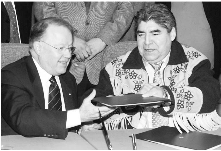
Le 7 février 2002, le grand chef crie Ted Moses et le premier ministre Bernard Landry signaient l'entente dite de la paix des Braves.

« C'est la suite logique et cohérente, a affirmé M. Landry. Nous avons établi, après des années tumultueuses, une relation exemplaire entre la nation québécoise et la nation crie. (...) Il est normal dans ces conditions, comme le dit le grand chef Ted Moses, de regarder ce que les partis ont à offrir. Il voit bien que c'est le nôtre qui, pour l'intérêt de son peuple,