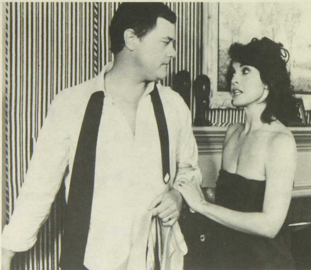
Larry Hagman, Linda Gray