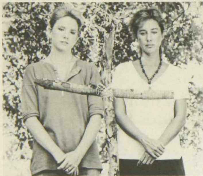
Melissa Gilbert, Pamela Bellwood