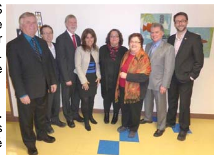
Les collaborateurs à la réalisation du projet

Le projet financé dépasse largement les limites du siège social de l'organisation. Il contribue au maintien des conditions locatives des organismes communautaires qui s'y logent à moindres frais, tout en y partageant des services. Le soutien accordé assure, entre autres, un développement cohérent des infrastructures et des services tout en véhiculant l'importance des valeurs communautaires. Il fait ainsi écho à des priorités inscrites au Plan quinquennal de développement de la région.