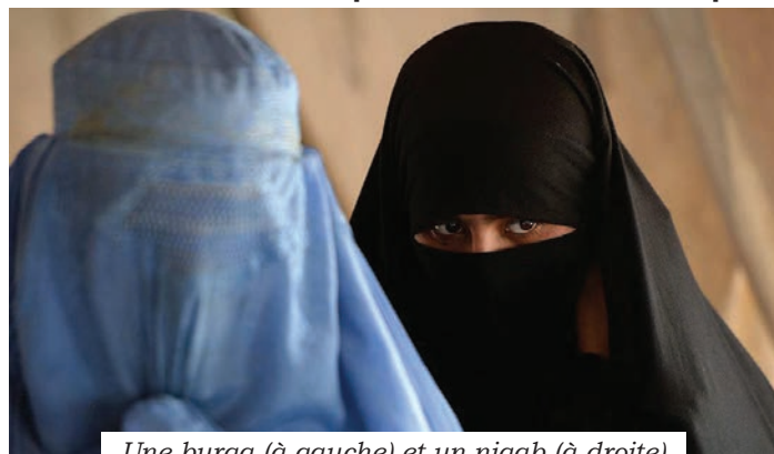
Une burqa (à gauche) et un niqab (à droite)

La loi 62 prévoit des accommodements raisonnables « tant qu'elle ne contrevient pas à l'identification, la sécurité et la communication ». L'exemple du transport en autobus est un contre-exemple pour démontrer comment cet article de loi est ridicule. Si une personne doit dévoiler son visage au chauffeur d'autobus pour s'identifier, elle ne peut pas avoir d'accommodement raisonnable de toute façon puisque cela contreviendrait à l'identification. Puis, dans tous les cas où on requiert de voir le visage d'une