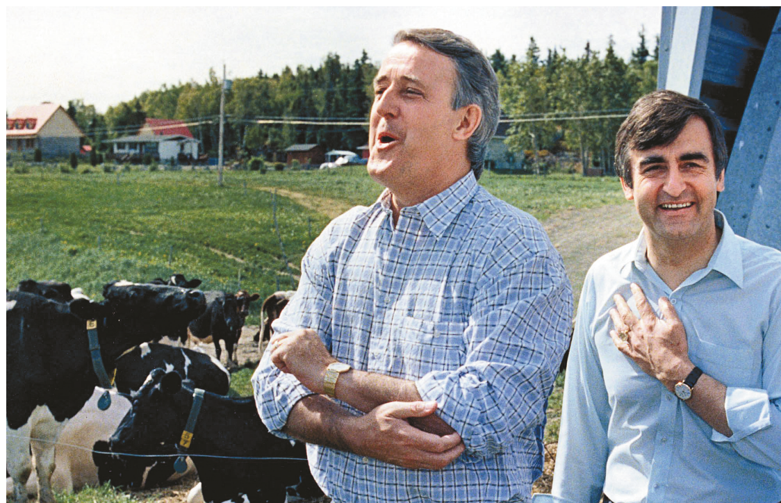
Brian Mulroney et Lucien Bouchard, jadis très proches, sont brouillés depuis l'échec du lac Meech.