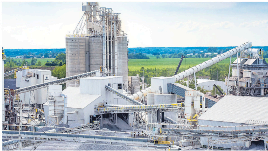
La transformation du calcaire est l'un des principaux axes de développement ciblés par les huit municipalités du pôle régional de Bedford.

Le terrain de la Municipalité du Canton de Bedford et les autres terrains privés concernés sont situés en zone verte, de part et d'autre du chemin de la Carrière, principale voie d'accès aux installations de la carrière Graymont.