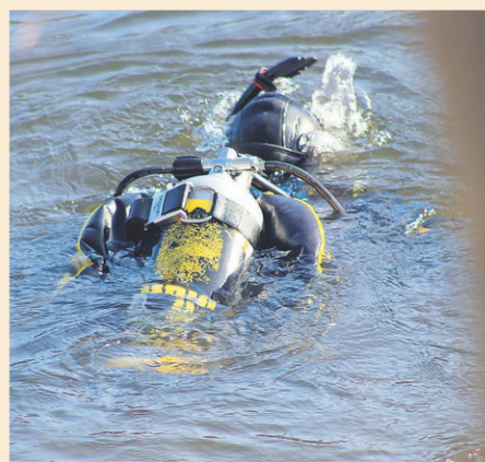
Sept plongeurs ont fouillé les eaux de la rivière Yamaska, à la hauteur de Farham, en novembre dernier. L'opération sera répétée dès le printemps prochain.

« En 2018, nous avons eu des appels et recueilli certaines informations qui valaient la peine d'être investiguées ou transmises aux enquêteurs des services policiers », ajoute M. Luce.