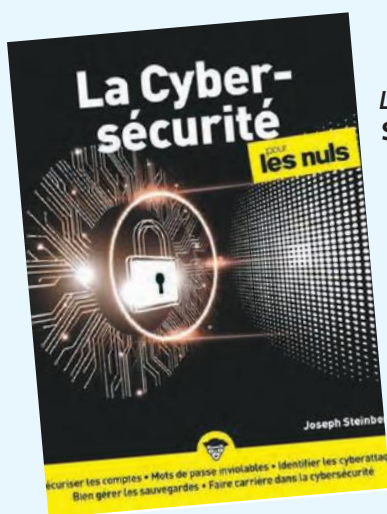
La cybersécurité pour les nuls / Joseph Steinberg; traduction, Daniel Rougé

Agréable à lire et très illustré, cet ouvrage 100 % pratique vous explique comment créer gratuitement votre site avec WordPress, le plus complet et le plus populaire des outils de gestion de contenu. Un livre qui s'adresse à tous ceux qui ne connaissent rien en développement Web et qui souhaitent créer leur site par eux-mêmes; aux particuliers ou aux professionnels qui veulent concevoir un site perso, un site vitrine, un blog; aux utilisateurs qui débutent avec WordPress ou qui ne le maîtrisent pas suffisamment.