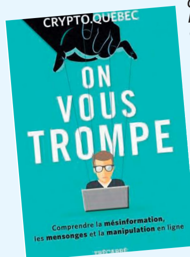
On vous trompe : comprendre la désinformation, les mensonges et la manipulation en ligne / Crypto-Québec

Débutants en informatique ou nouveaux venus dans le monde d'Office 2021... ce livre est fait pour vous! Vous y trouverez une approche simple et visuelle des principales actions pour maîtriser la suite Office 2021 : rédiger un texte et le mettre en forme, ajouter des cadres, des images ou des tableaux, effectuer des calculs, manipuler les cellules et les feuilles de calcul, créer et modifier une présentation... Plus de 140 tâches indispensables pour tout réussir avec Word, Excel et PowerPoint!