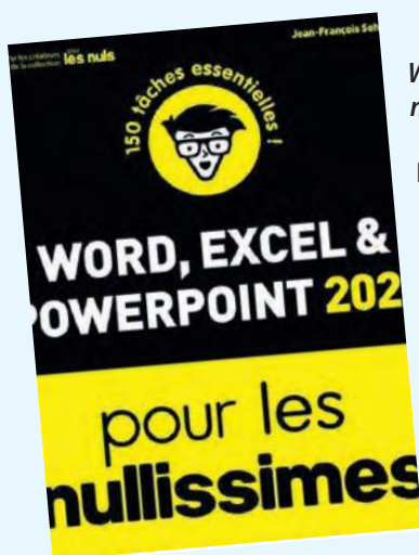
Word, Excel et PowerPoint 2021 pour les nullissimes / Jean-François Sehan

La photo fait partie de notre quotidien, et Photoshop Elements est devenu un outil largement utilisé par les amateurs et les professionnels. Ce livre, qui s'adresse aussi bien aux utilisateurs de Windows que de Mac, fournit une étude complète de ses innombrables fonctionnalités. Découvrez comment appliquer des retouches de base, améliorer vos prises de vue, organiser et cataloguer les images, dessiner et écrire sur les photos, corriger le contraste, la couleur et la netteté et plus encore.