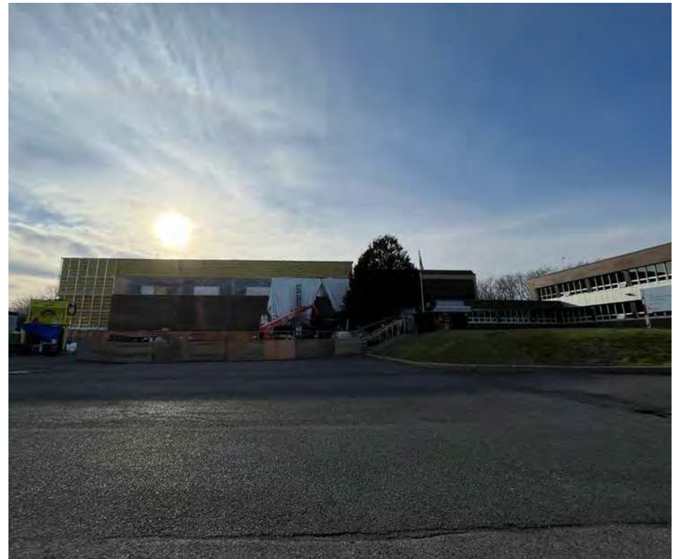
Les travaux de l'école Jacques-Rocheleau ont pris du retard.

Même si les travaux ont repris au cours des derniers jours, la cure de rajeunissement de l'école Jacques-Rocheleau, à Saint-Basile-le-Grand, tarde à prendre forme.