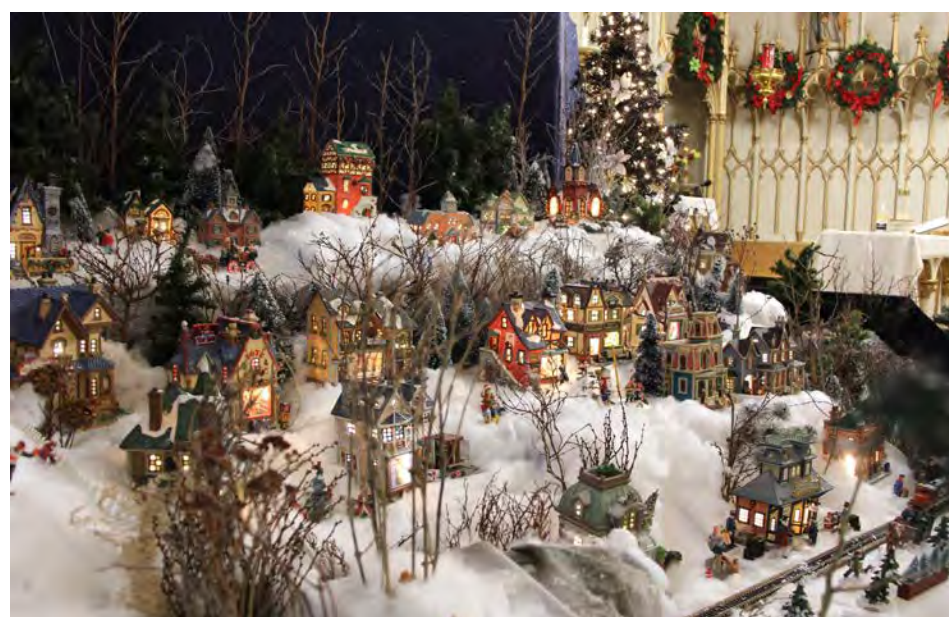
Une partie du village miniature de Noël.

Il ne faut pas se méprendre. Le village miniature de l'église n'est pas le village de Saint-Basile-le-Grand... « Ce n'est pas lui que l'on reproduit en miniature, mais c'est l'esprit d'un lieu chaleureux, rassembleur, animé. On reproduit en petit ce genre de lieu rassembleur que l'on met en valeur en plus grand. »