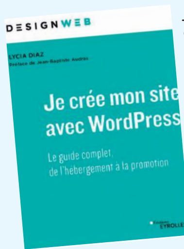
Je crée mon site avec WordPress : le guide complet, de l'hébergement à la promotion / Lycia Diaz