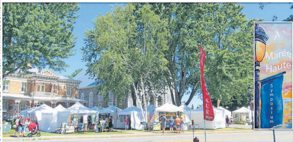
L'artiste sélectionné se verra offrir gratuitement un emplacement pour exposer et vendre ses œuvres ainsi que des repas et des collations pour la durée du symposium À marée haute de Champlain .

La personne choisie aura l'opportunité de