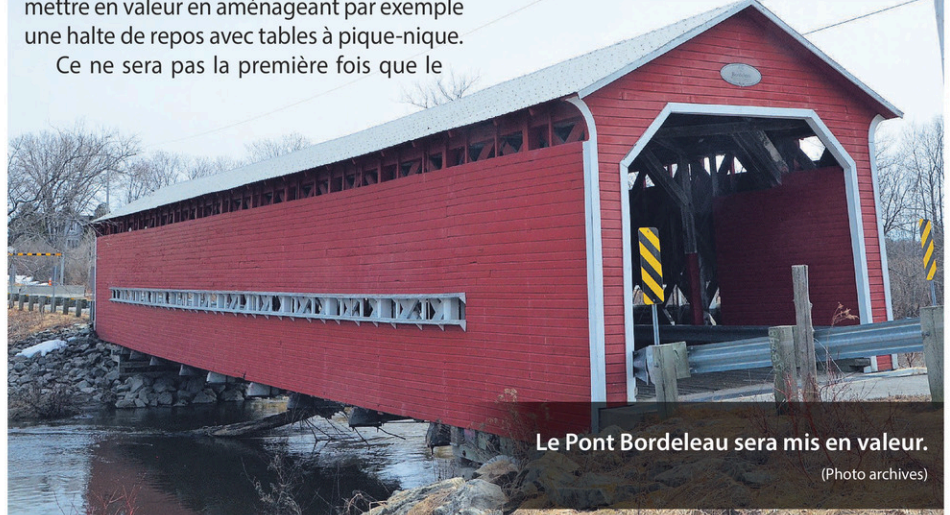
Le Pont Bordeleau sera mis en valeur.

Le MTQ a déjà procédé à des tests de sondage de sols sur le site.