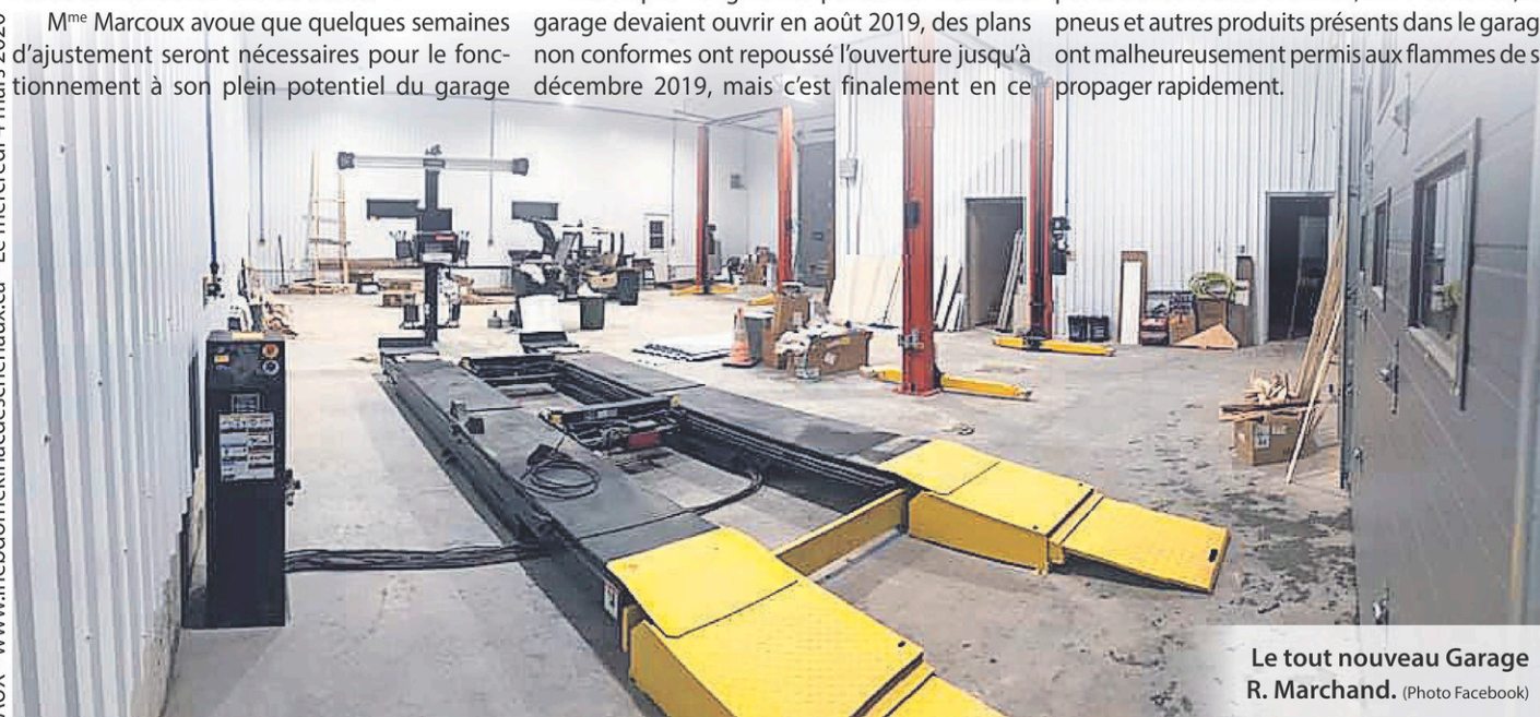
Le tout nouveau Garage R. Marchand.