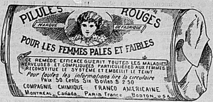
Fac-similé exact d'une boîte de Pilules Rouges.

Nos Pilules Rouges sont une spécialité pour les maladies des femmes seulement; c'est ce qui fait leur force et leur popularité. Il est impossible à un remède de guérir tous les maux. Jamais, dans l'histoire de la médecine, un remède n'a obtenu autant de guérisons que nos Pilules Rouges. Nous demandons à nos nombreuses clientes de ne pas comparer nos Pilules Rouges aux autres remèdes guérissant tous les maux, entre autres, aux remèdes liquides qui ne doivent leur effet stimulant qu'à l'alcool qu'ils renferment.