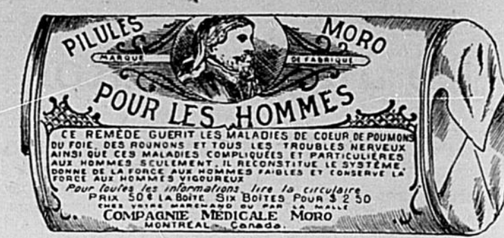
Fac-Simile exact d'une boîte de Pilules Moro.

Donnez-nous un homme brisé par les excès, la dissipation, un travail trop dur, les tracas, ou par toute autre cause qui ait sapé sa vitalité, avec les Pilules Moro nous le rendrons aussi vigoureux en tous points, que n'importe quel homme de son âge.