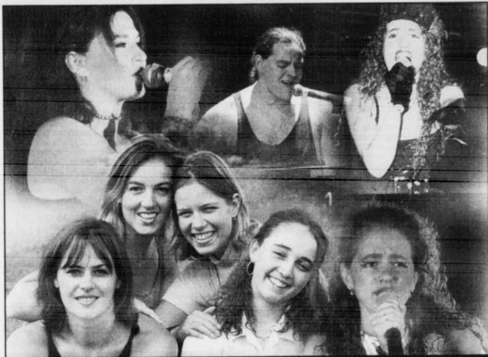
QUÉBECISSIME: CKRS-télévision nous amène dans les coulisses du Capitole où la troupe Québecissime se prépare à la grande première à Québec.

Dieu à Quatre Saisons Guy A. Lepage est le premier invité de la première émission de Dieu reçoit, à Quatre Saisons, mardi, 19h. Claude Legault se prend donc pour Dieu dans cette nouvelle émission hebdomadaire où l'on nous promet des sketches humoristiques. On pré-