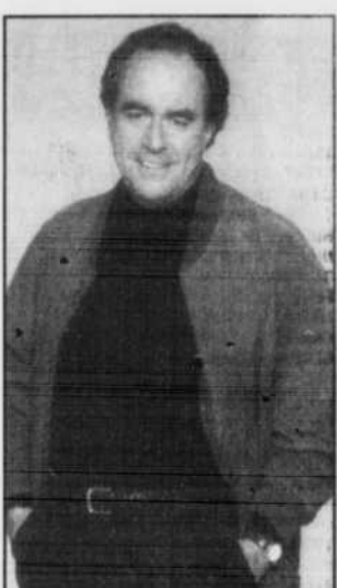
«Zone Libre» vendredi 21 h 00 à Radio-Canada

6h00. 01h10 TOC - CIVV — ATTENDEZ QUE JE VOUS RACONTE... 1685488 01h25 SE — ALERTE MÉTÉO 17036662 (1h40) 01h30 RDS — MISS AMERICA, EN FORME (R) 216662 SPNET — GOLF SPGA (R) En provenance de Tampa Bay en Floride, 1re ronde de la Classique GTE (1h30) RDI — GRIFFE (R) 8143372 DISC. — INVENTION (R) 547339 CANAL VIE — TRAUMA (R) 4293469 (1h) 01h35 WPTZ — FRIDAY NIGHT 35320372 (1h) 01h52 WCAX — EXTRA! 5235020 02h00 FC — THE DEVIL'S ADVOCATE 879662 (2h30) RDS — SPORTS 30 MAG (PD) 682681 TSN — TSN SPORTSDESK (D) 368759 (1h) EN DIRECT CANAL D — ARNAQUES (R) 8267310 (1h) Voir 20h00. RDI — BRANCHÉ (R) 3523730 DISC. — DISCOVERY'S CANADA (R) 717001 (1h) LIFE — EXTRA 3845488 02h10 CFCF — DOUBLE FEATURE 15396099 INFERNO. (2h02) 02h15 TV5 — COMME AU CINÉMA (R) 9272407 02h22 WCAX — PUB 4847223 02h30 RDS — GOLF PGA (R) 954391 En provenance de Pacific Palisades en Californie, 2e ronde du Nissan Open. (2h) RDI — LE JOURNAL DU PACIFIQUE 3542865 LIFE — WHAT'S FOR DINNER? 3857223 CANAL VIE — VICTOIRE (R) 3539643 02h35 WPTZ — THE TONIGHT SHOW WITH JAY LENO (R) 29894846 (1h) 03h00 TSN — OFF THE RECORD (R) 440952 SPNET — SPORTSCENTRAL (3h) CANAL D — PIECES À CONVICTION (R) 9820681 (1h) Voir 21h00. RDI — LE JOURNAL DU MANITOBA 7743049 DISC. — WILD DISCOVERY: ANIMAL PLANET (R) 796759 (1h) LIFE — NATURE WALK 9633001 CANAL VIE — L'HOPITAL CHICAGO HOPE (R) 4209020 (1h) 03h05 SE — LA RELIQUE 85304136 (1h55) 03h30 TSN — BEST OF GALLAGHER (R) 794402 RDI — LE JOURNAL DE L'ONTARIO 3533117