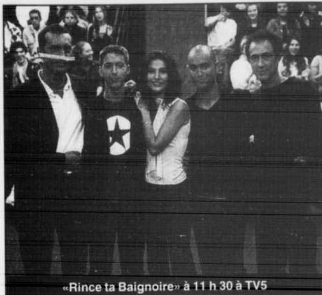
«Rince ta Baignoire» à 11 h 30 à TV5

WCFC — THE OUTSIDE EDGE 119865 Comédie britannique. Il semble que c'est le