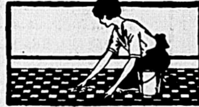
Planchers peints ou linoléums sont restaurés à neuf. Gillex tout simplement dissout l'huile, libère la saleté qui est ensuite rinçée et époncée sans affecter la surface.

Le Gillex enlève la saleté la plus opiniâtre qui s'en-crasse dans les tissus. Le Gillex dissout l'huile qui tient cette saleté. Les particules de crasse se rincent alors sans le frottage qui use et déchire le linge. Le Gillex ne contient aucun gravier ni acide injurieux. N'en employez pas plus que les quantités spécifiées dans les directions. La graisse disparaît dans un seul rinçage. C'est pour cela que le Gillex accélère le travail de la cuisine; les pots, les cannettes à lait, les poêles sont nettoyés dans un instant. Les surfaces peinturées et les linoléums sont restaurés rien qu'en les épongeant. Pourquoi? Parce-que toute saleté est huileuse. Le Gillex tout simplement dissout l'huile et libère la saleté, qui est tout simplement époncée ou rinçée sans nuire à la surface. Ne fait pas tort aux mains. Le Gillex laisse la peau blanche, douce et odorante.