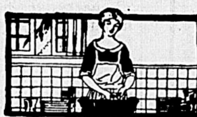
Gillex expédie le travail de la cuisine. Pots, casseroles et cannettes à lait sont nettoyés dans un instant.