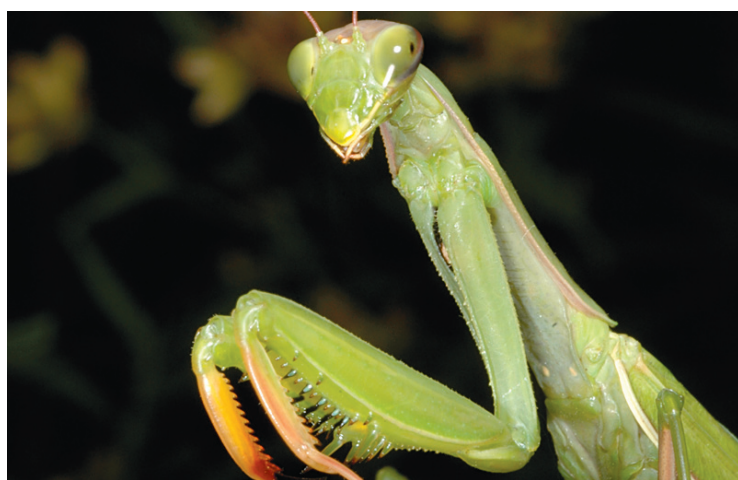
INSECTARIUM DE MONTRÉAL

L'Insectarium accueillera les visiteurs jusqu'au 2 janvier.