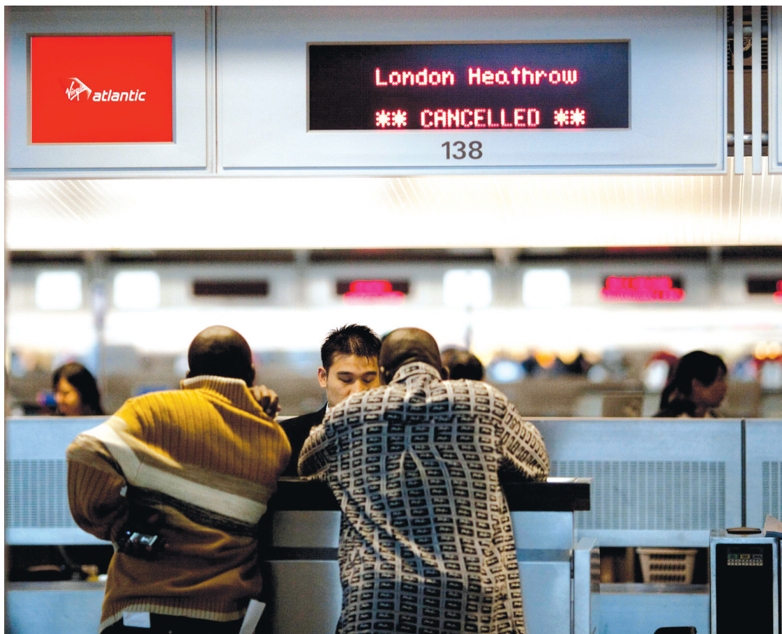
Deux passagers à San Francisco ont vu leur vol pour Londres être annulé hier.