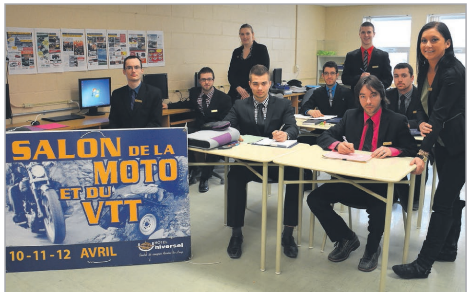
Les membres du comité organisateur.

« Les élèves de Vente-Conseil ainsi que les concessionnaires seront sur place et heureux de vous accueillir tout au long de l'évènement. Cet événement s'avère être un défi intéressant pour nous. C'est le prolongement de notre formation académique, qui fut d'ailleurs très riche en apprentissages, ce qui nous a permis de consolider notre choix de carrière », ont expliqué les membres du comité organisateur.