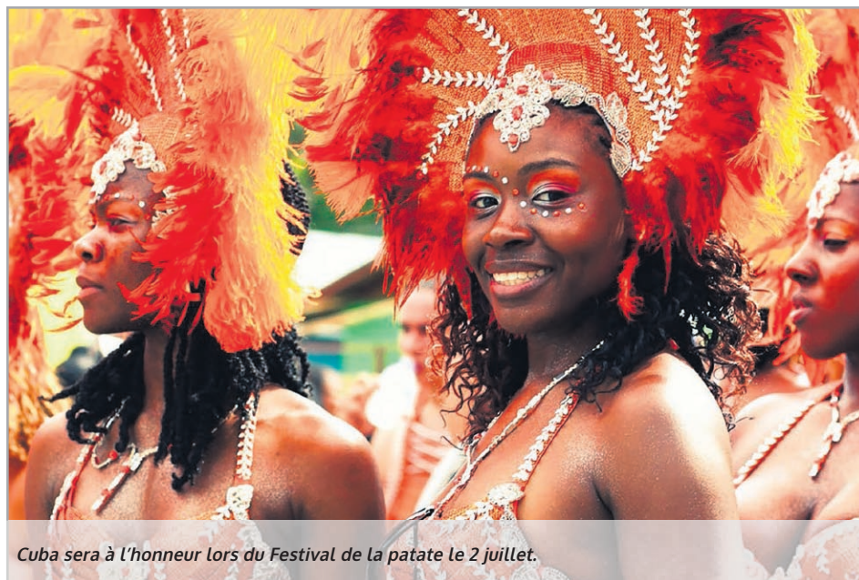
Cuba sera à l'honneur lors du Festival de la patate le 2 juillet.

L'évènement aura lieu sur le boulevard Broadway à Grand-Sault.