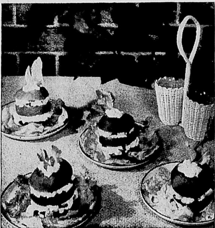
Voici une touche dynamique pour un buffet en plein air. Les produits laitiers ajoutent leur fraîcheur à celle de la tomate.