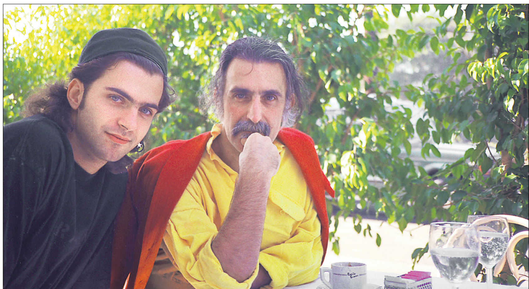
Dweezil Zappa, qui sera en spectacle demain soir au Métropolis, photographié aux côtés de son célèbre père, Frank, un peu avant la mort de celui-ci.