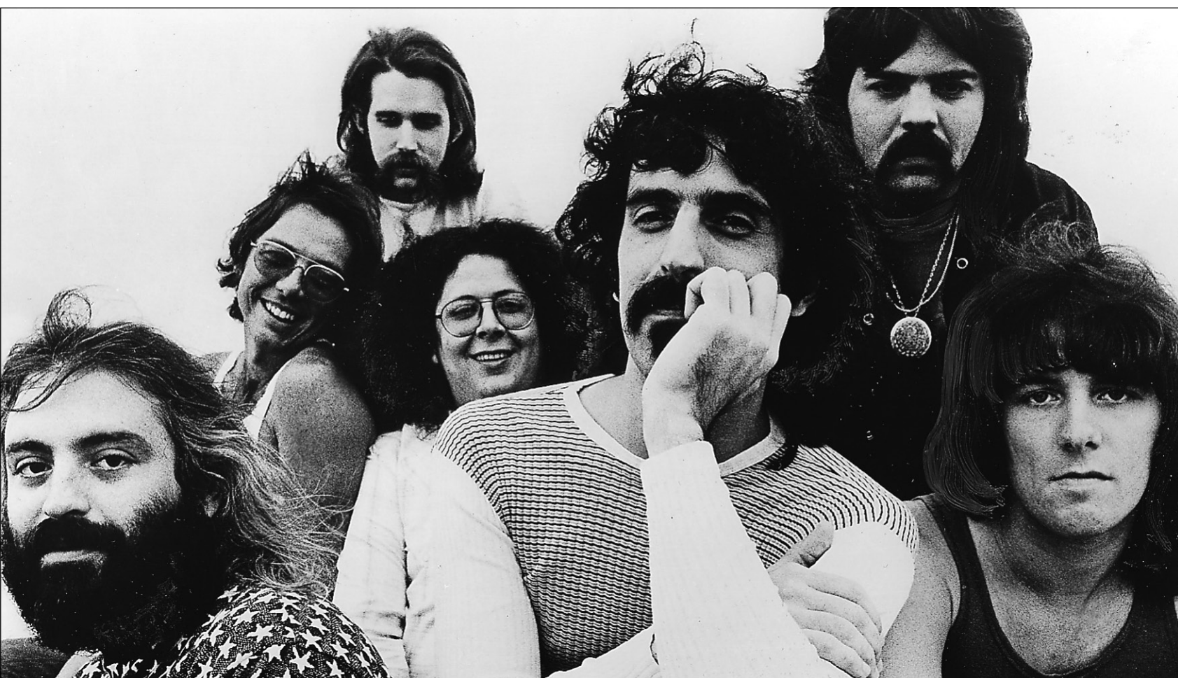
Frank Zappa (au centre) avec son groupe The Mothers of Invention au début des années 70.