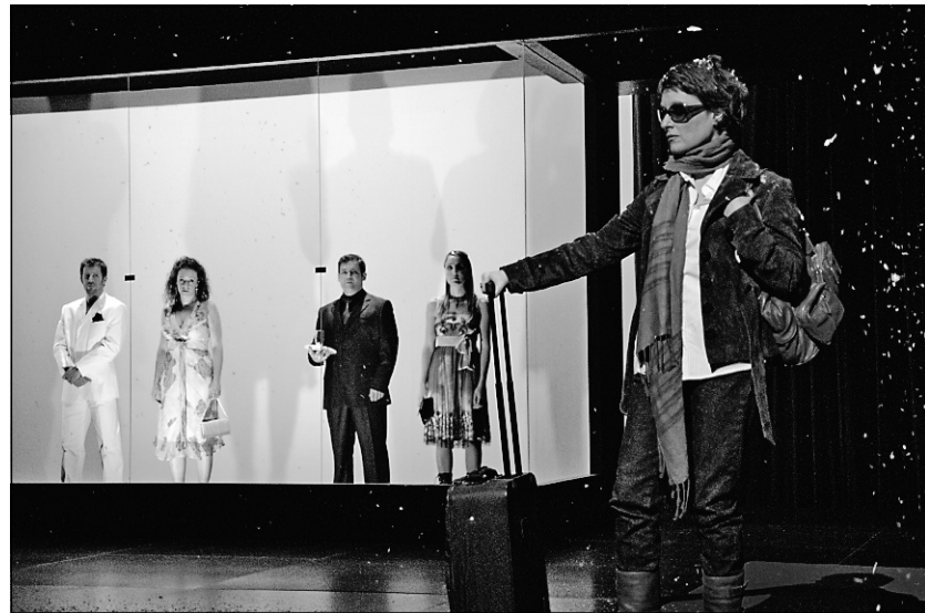
La pièce Couche avec moi (c'est l'hiver) aborde les thèmes de la pornographie, des relations de couple, de la télé-réalité et de l'humour au Québec.

Le spectacle mis en scène par Geoffrey Gaquère, soutenu par cinq solides comédiens et une musique enlevante (de Nicolas Basque), est un bon moment de théâtre composé de scènes courtes et rythmées. Couche avec moi (c'est l'hiver) nous parle avec acuité de l'ici et du maintenant. On observe le curieux destin de cinq personnages «tout seuls