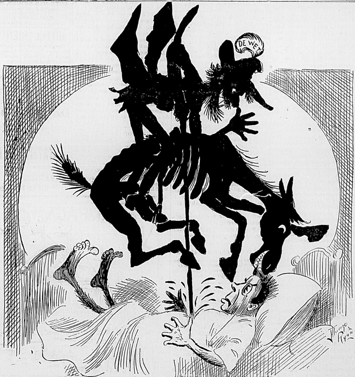
LE CAUCHEMAR DE CHAMBERLAIN

Pour les Rhumes obstinés, le Croup, l'Asthme, la Grippe, etc., etc., donnez le