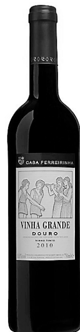
Douro 2010 Vinha Grande Casa Ferreira, 18,95 $ (865329)

Très coloré sans qu'il soit opaque, ce très beau vin rouge du Douro se présente avec un généreux bouquet de fruits noirs, avec aussi quelques nuances de fruits rouges. La bouche suit, charnue, dense, relativement corsée, bâtie sur de beaux tannins bien enrobés, avec une bonne persistance. À prix très correct compte tenu du niveau qualitatif. 30% Touriga Nacional, 30% Touriga Franca, 25% Tinta Roriz et 15% Tinta Barocca, avec élevage en fûts de chêne français. 13,5% (159 caisses). Garde : 2014-2020.