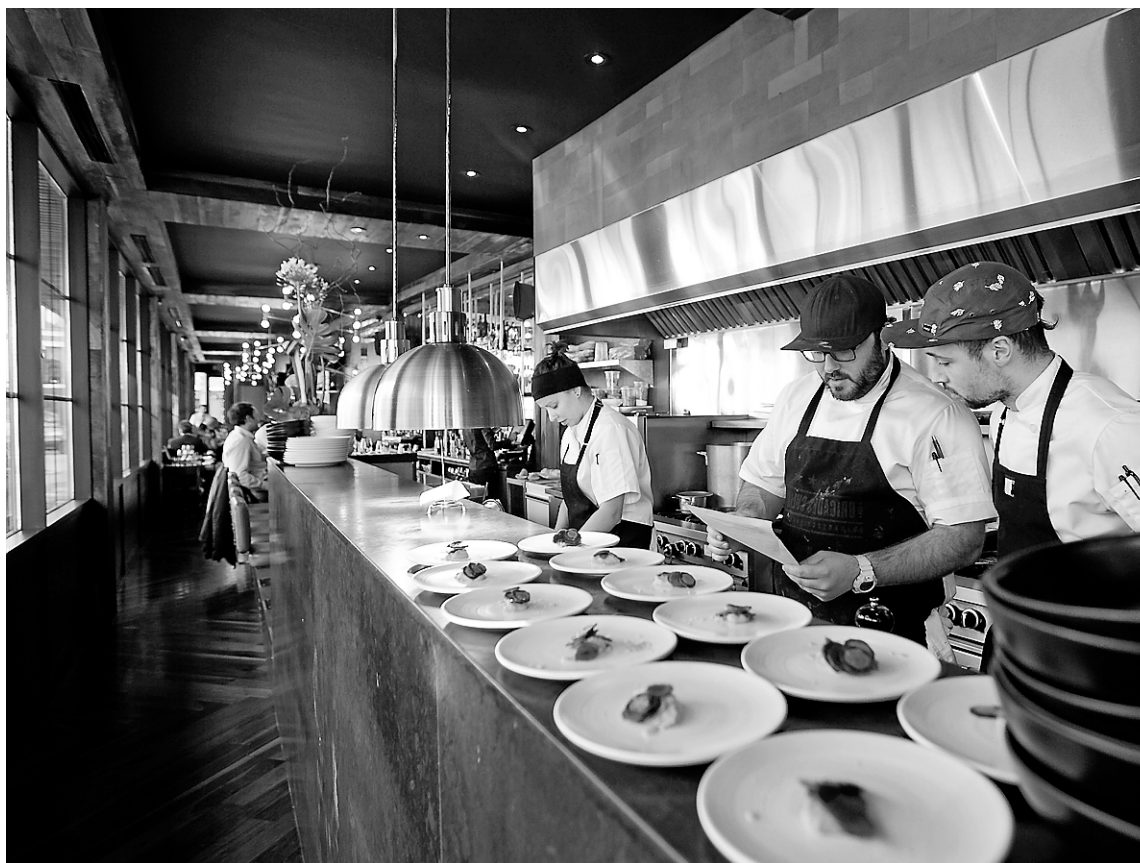
Le lieu, d'entrée de jeu, est très bien aménagé. On a rénové l'ancien greasy spoon Luigi avec soin.

Après deux repas, dont un souper à quatre personnes, j'ai pratiquement essayé tout le menu, dont certains éléments