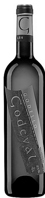
Valdeorras 2011 Godello Godeval, 21,40 $ (11412959)

Très joli vin blanc espagnol, élaboré avec seulement du Godello, un cépage peu connu (comme d'ailleurs le Garganega), au bouquet invitant, net, assez peu aromatique et non boisé. De corps moyen, ses saveurs sont bien affirmées, et il a du tonus, grâce à une acidité bien présente, ressentie surtout en fin de bouche, sans qu'elle soit excessive. Équilibré et très bon. 13% (90 caisses). Garde : 2014-2015.