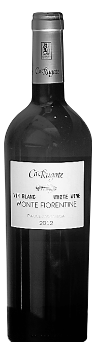
Soave Classico 2012 Monte Fiorentine Ca'Rugate, 20,50 $ (10775061)

Autre Soave, mais affichant plus de caractère que le précédent, non boisé également, son bouquet, qui ne manque pas de nuances, est alléchant et marqué par quelque chose de salin. Tout au plus moyennement corsé comme vin blanc, ses saveurs sont franches, et on y retrouve cette note saline qui (je l'ai testé) fait merveille avec les huîtres. 100% Garganega. Délicieux. 12,5% (74 caisses). Garde : 2014-2017?