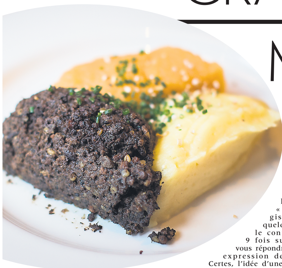
Haggis servi avec des pommes de terre et du navet en purée.