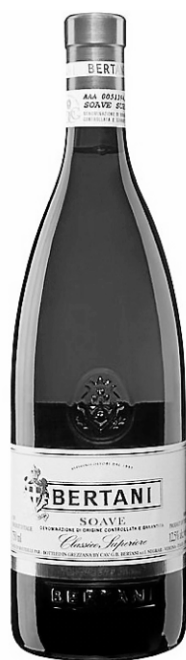
Soave 2012 Bertani, 13,05 $ (25007)

Bref, et après avoir longtemps croupi aux enfers, la divine Bourgogne a conservé son âme!