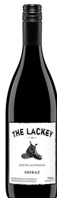
South Australia 2010 Shiraz The Lackey, 19,95 $ (10959725)

Vin rouge australien de Syrah (Shiraz pour les Australiens), son bouquet de bonne ampleur, de fruits noirs, semble un peu bizarre à l'ouverture de la bouteille, puis, en agitant le vin dans le verre, le côté, sans doute révélateur, comme on dit, disparaît et on a droit à un bouquet de qualité, invitant. Suit une bouche bien en chair, avec du corps et des tannins gras, le tout dépourvu de ces notes d'eucalyptus (ou de menthe) autrefois fréquentes dans les rouges d'Australie. Élevage en fûts de chêne français dont 10% de neufs. Impeccable. 14,5% (206 caisses). Garde : 2014-2019.