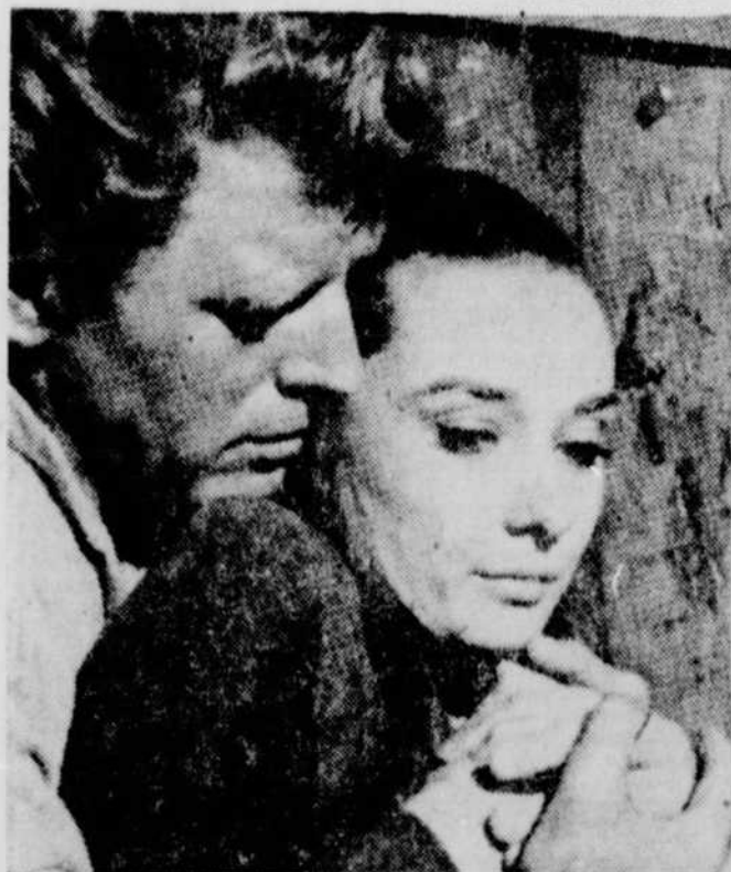
Radio-Canada met à l'affiche de son Billet de Faveur, samedi le 11 à 20 h. 00, le film "Vent de la plaine". Un excellent Western signé John Huston.