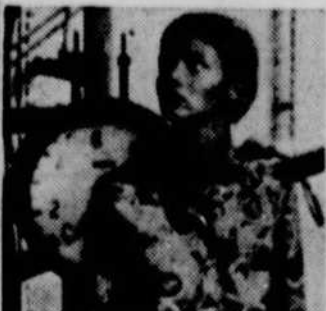
Votre Ciné-club du dimanche 12 août vous propose le film: "L'Eden et après" de Robert Grillet.