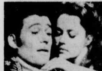
L'émission Les Grands Films vous présenteront cette semaine un film intitulé "La Grande Catherine".