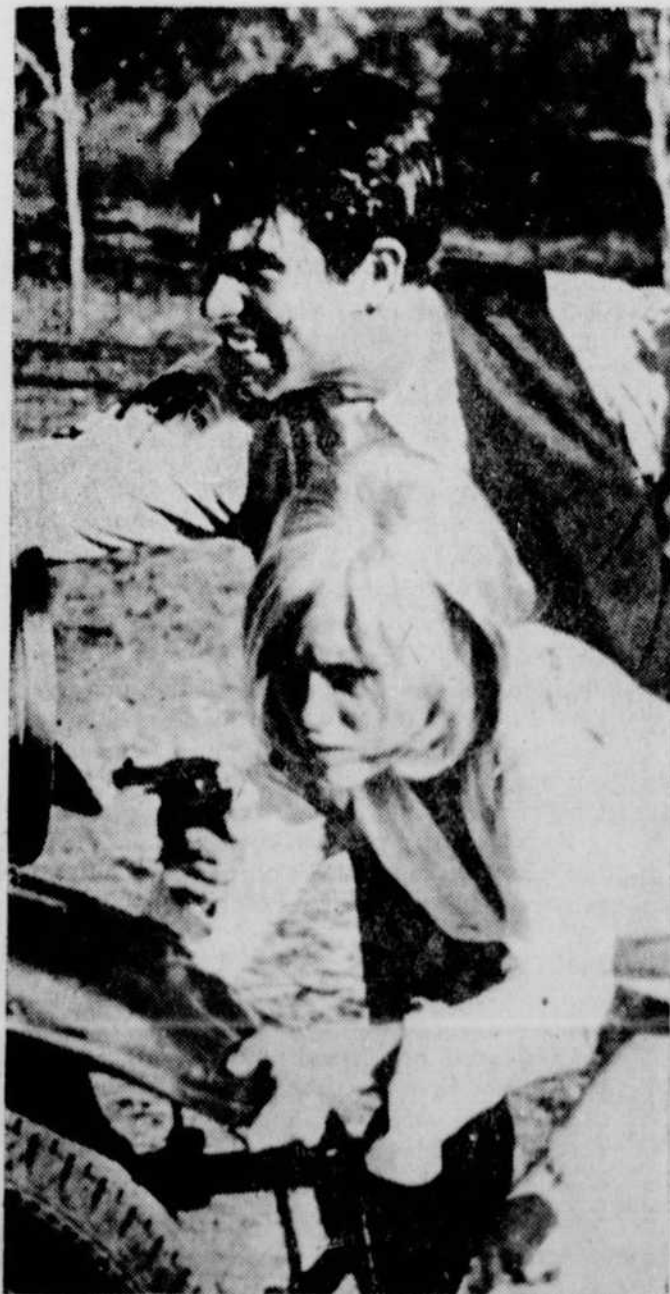
Bonnie Parker et Clyde Barrow sont constamment poursuivis par la police, et ils n'hésitent pas à tuer ceux qui menacent leur liberté.

ST-ROMUALD — "Dracula prisonnier de Frankenstein" samedi et dimanche à 6.00 et 9.00. Sur semaine à 9.05. "Vierges pour Santiana" samedi et dimanche à 7.30. Sur semaine à 7.30.