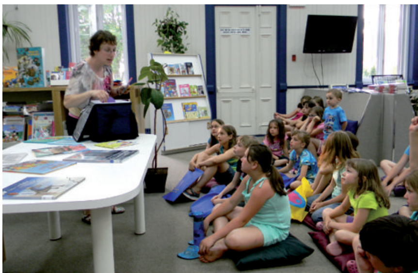
Activités culturelles, bibliothèque Léo-Pol-Morin

La bibliothèque municipale créée en 1961 et reliée, depuis 1981, au Centre régional de service aux bibliothèques publiques (CRS-BP), assure le prêt de volumes et divers services de consultation. Elle est informatisée depuis 1998. On lui a donné le nom de Léo-Pol-Morin le 4 octobre 1991, en hommage au musicien de réputation internationale né à Cap-Saint-Ignace en 1892. Depuis le 1 er décembre 2013, elle offre des livres numériques et audio. La concrétisation de l'Heure du conte pour les tout-petits ainsi que le club de lecture : livromagie, livromanie, sont des initiatives très prisées et appréciées.