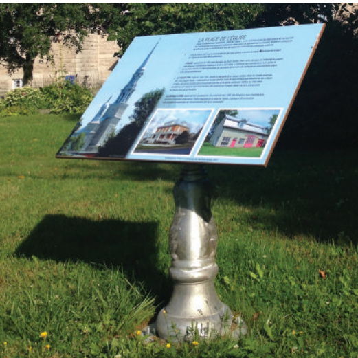
Presbytère, église et grange à dîme