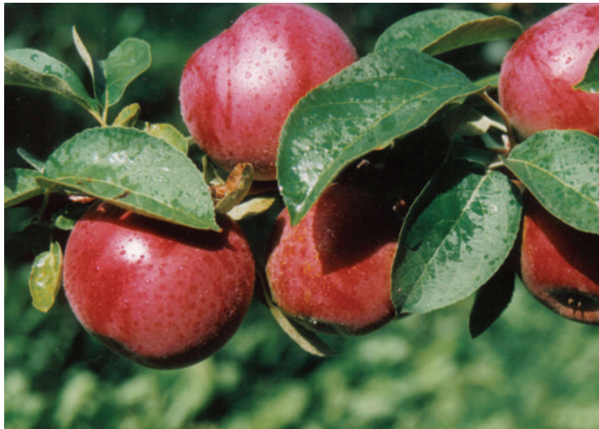
Pommes prêtes pour la cueillette

Des efforts de concertation ont déjà été amorcés afin que ces événements et d'autres qui devraient être créés soient des moments rassembleurs pour la population et des occasions de mettre en valeur la production locale. Il importe d'intensifier ces efforts pour que de tels événements deviennent des moments significatifs de la culture des citoyennes et citoyens de Cap-Saint-Ignace.