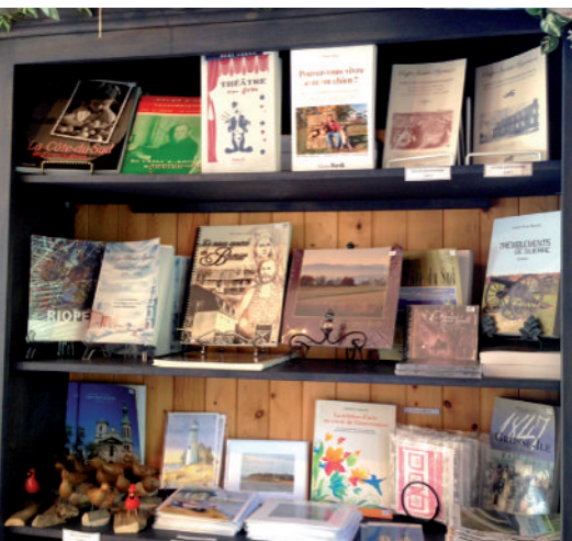
Kiosque touristique - documentation