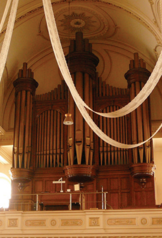
Orgue de l'église