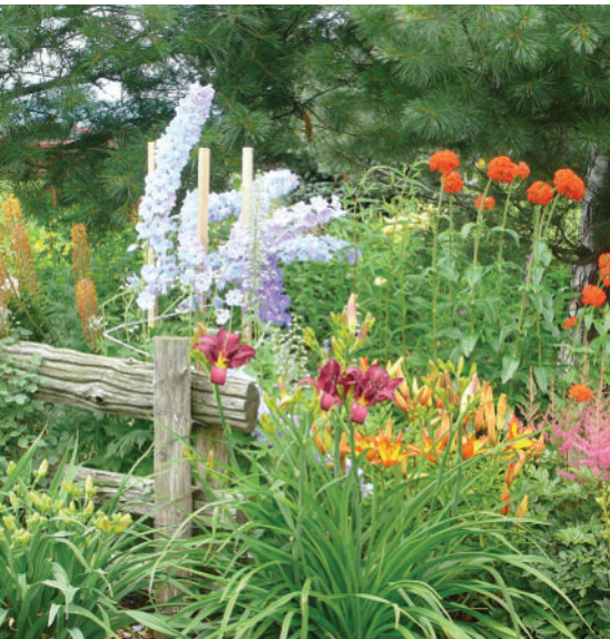
Journée Petits jardins

Les Journées de la culture ont été l'occasion depuis l'an 2000 de proposer des activités visant à mettre en valeur des établissements locaux œuvrant dans l'édition et la publication et des pratiques reliées à l'histoire locale. Une diversité d'activités culturelles a augmenté ces journées dédiées à la culture telles que les conférences sur les chantiers maritimes en 2012 et sur les vergers historiques en 2013.