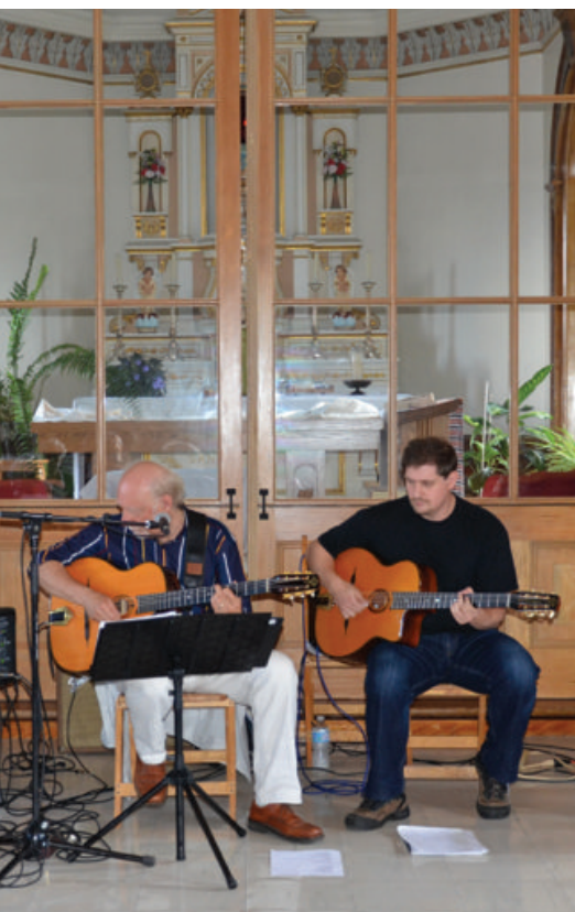
Café-concert, Swing club 2010