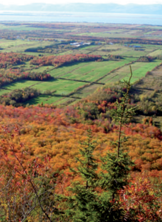
Pain de sucre