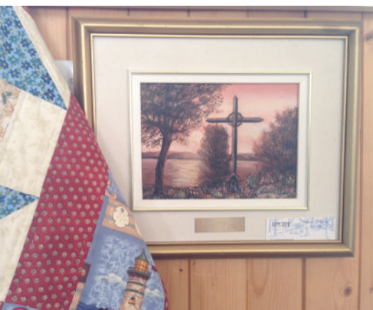
Courtepointe et peinture

Il importe donc que la Municipalité se dote, dans les meilleurs délais, d'outils de planification et de réglementation, de moyens de sensibilisation, de mesures d'aide à la restauration domiciliaire et à la protection de sites patrimoniaux et archéologiques comme le règlement mis en place pour la protection du noyau institutionnel.