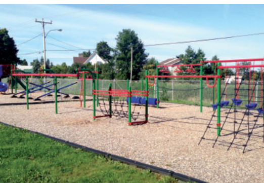
Parc-école municipal Mgr-Sirois