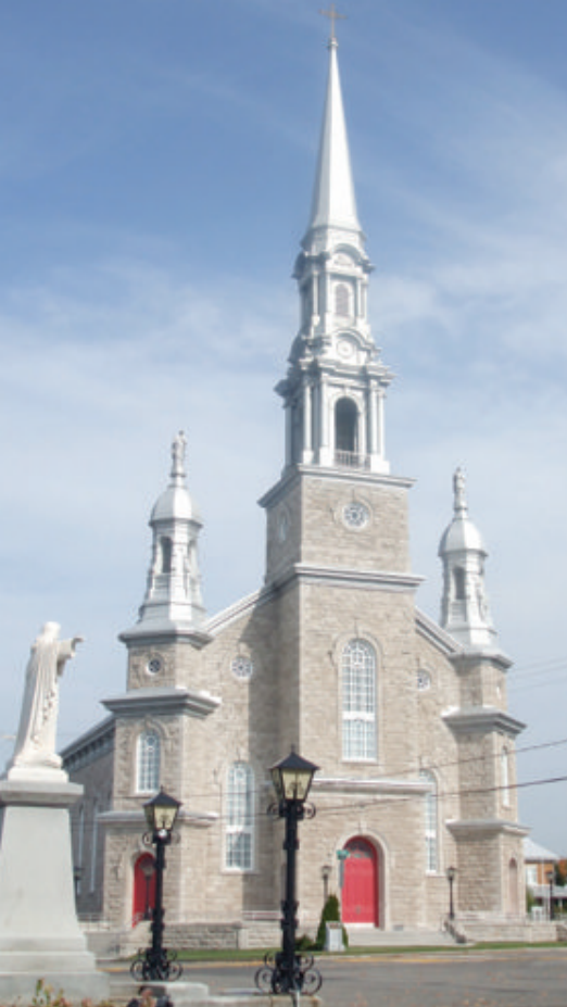
Église et Sacré-Coeur