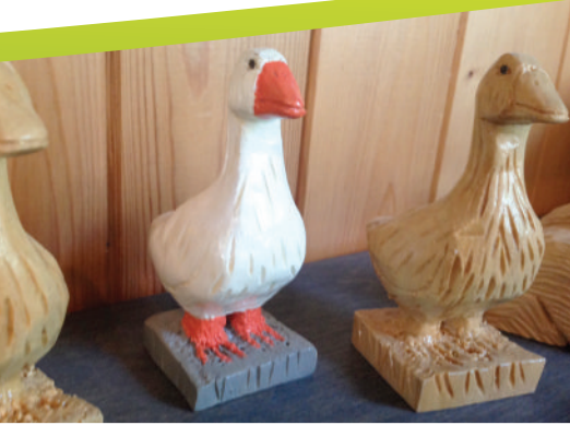
Kiosque touristique - Sculptures