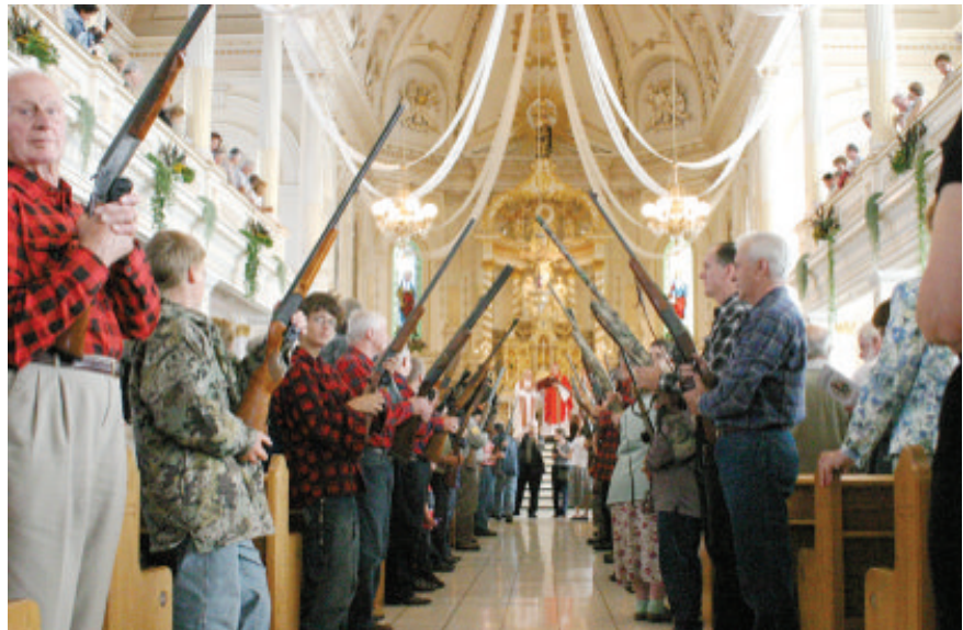
Messe de la Saint-Hubert, chasseurs