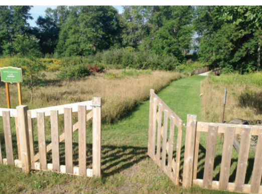
Réserve naturelle - Entrée