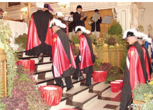
Messe de la Saint-Hubert - Chevaliers de Colomb