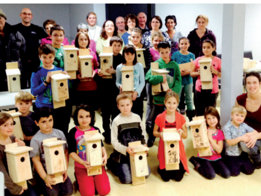
Fabrication de nichoirs