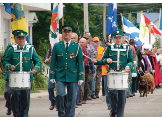
Garde paroissiale - Saint-Hubert