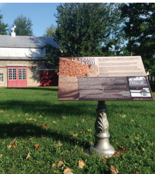
Panneau d'interprétation Grange à dîme