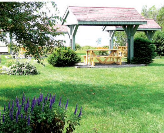
Cour arrière halte routière