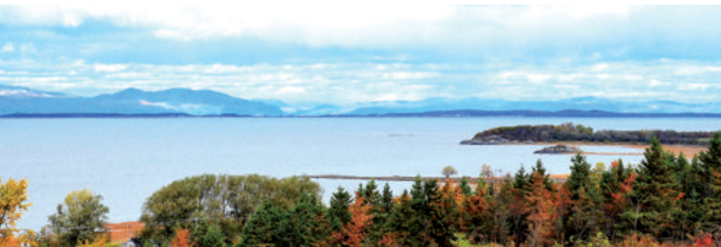
Cap-Saint-Ignace - Panorama

Les pages suivantes présentent chacun de ces objectifs ainsi que des propositions d'action visant à permettre leur exécution.