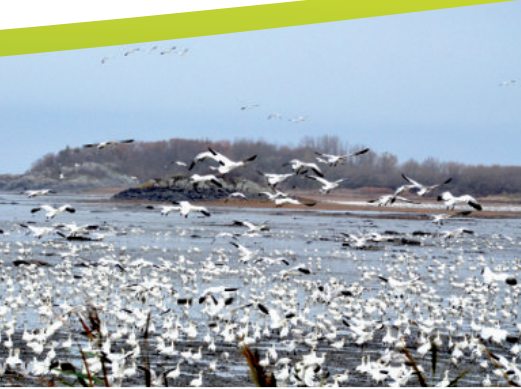
La batture et ses oies blanches