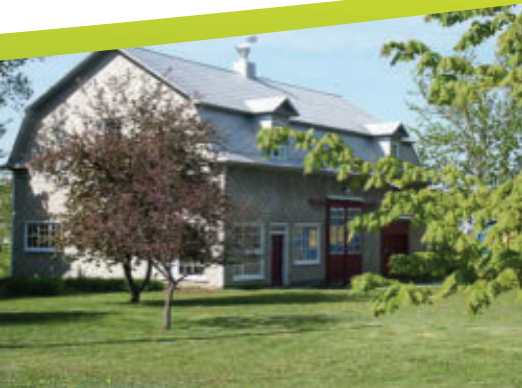
Grange à dîme