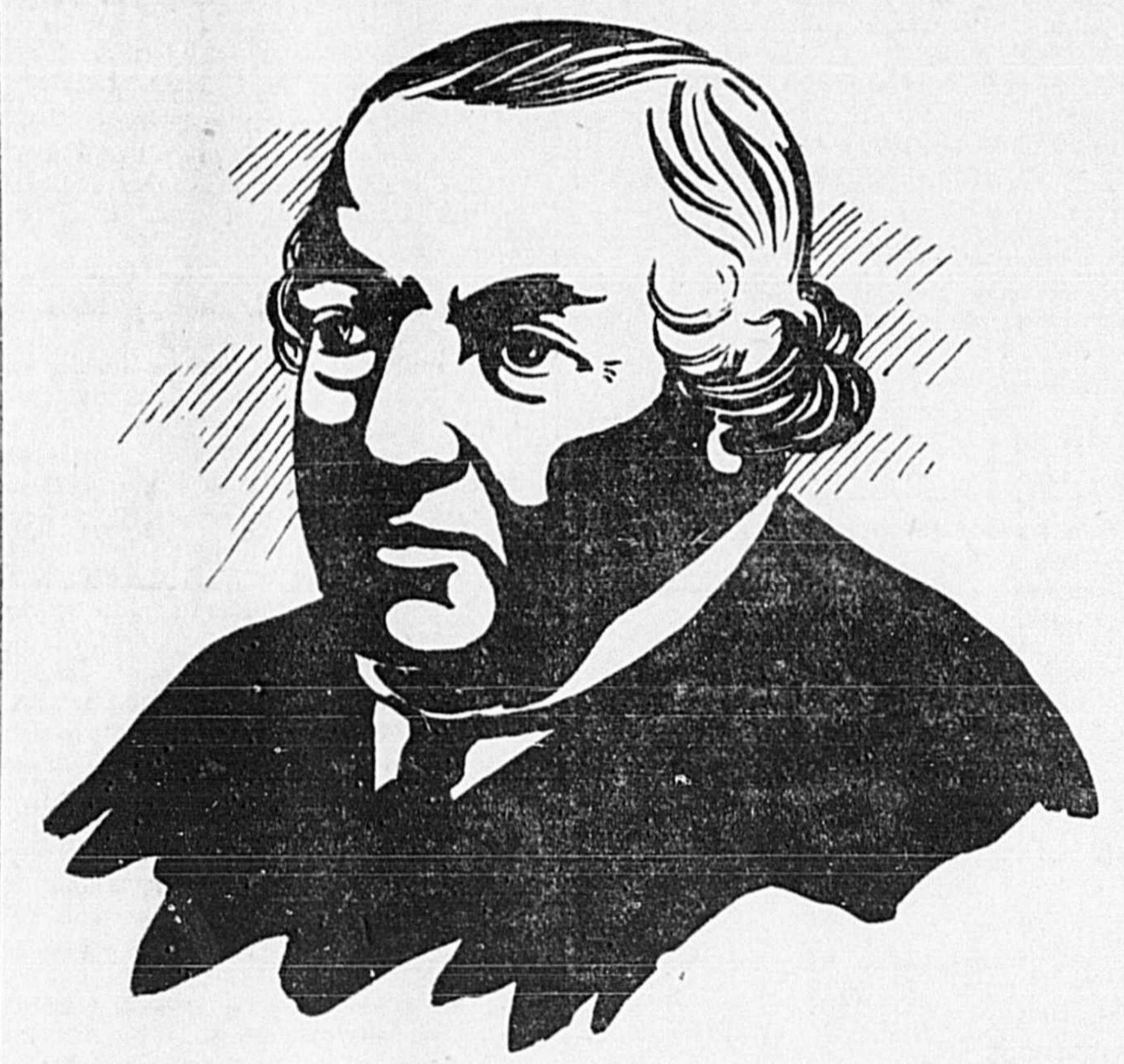
SIR CHARLES TUPPER

SYMPATHIQUE A L'ENDROIT DES CANADIENS-FRANÇAIS ET DES CATHOLIQUES. — L'EXTENSION DU RESEAU DU PACIFIQUE JUSQU'AU PORT DE MONTREAL. — SES PREDICTIONS AU SUJET DU GRAND-OUEST. — SON ATTITUDE RELATIVEMENT A LA QUESTION SCOLAIRE DU MANITOBA. — SON IMPERIALISME. — QUAND NOUS AVONS BESOIN D'IMMIGRANTS, POUVONS-NOUS FOURNIR DES HOMMES A L'ANGLETERRE.