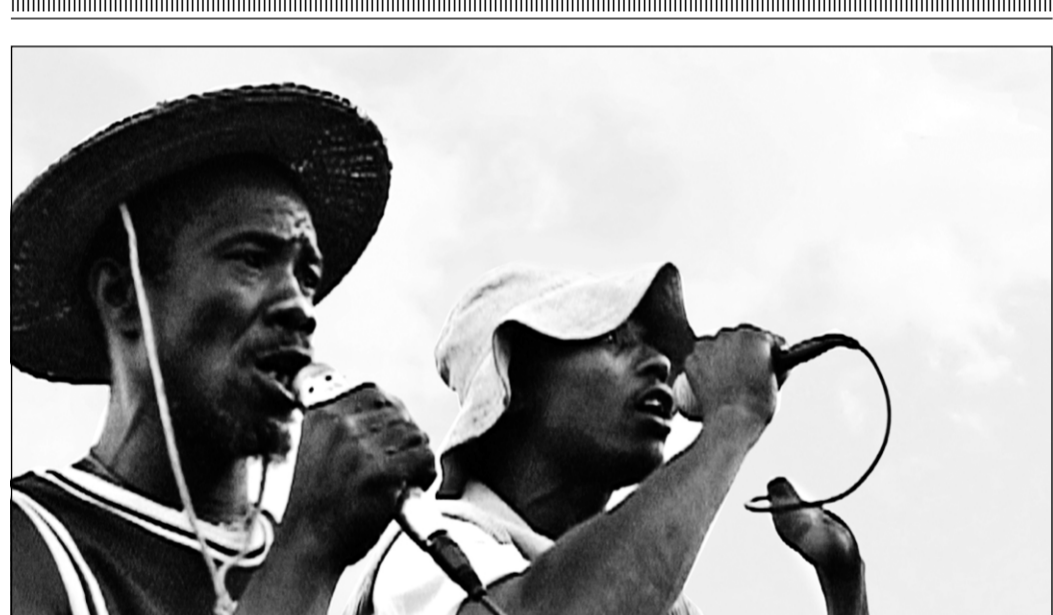
Le nom du groupe, The Refugee All Stars of Sierra Leone, donne une idée de son histoire.