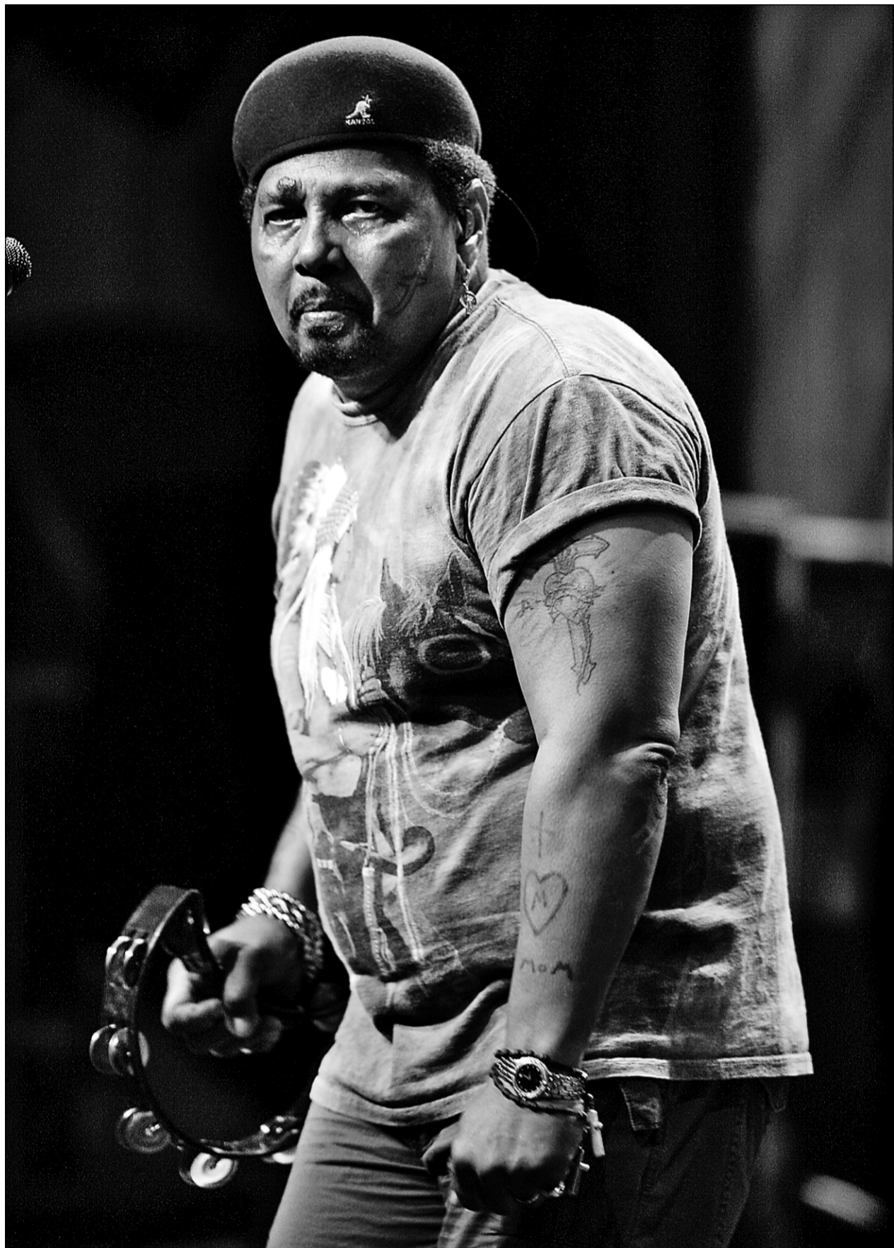
Aaron Neville (notre photo) et ses frères Charles, Arthur et Cyril ont donné le coup d'envoi du volet extérieur du Festival international de jazz de Montréal, hier.

Mais il n'est pas certain qu'ils allaient garder ce rythme longtemps. Selon le programme remis aux journalistes, une autre ballade d'Aaron était au programme ( Tell It Like It Is ) et la soirée devait se terminer avec Amazing Grace ... Rien pour mettre le feu dans la place.