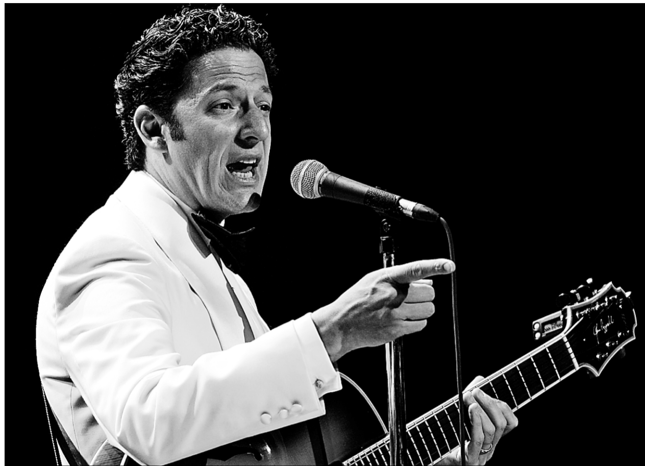
John Pizzarelli junior sur la scène de la salle Wilfrid-Pelletier de la Place des Arts hier.

John Pizzarelli junior n'est pas une grande voix, ou en tout cas pas une voix aussi imposante, que ce soit dans l'autorité ou dans la sensibilité, que celle du grand Sinatra. Mais sa chaleur, son plaisir évident, et surtout son talent de guitariste compensent pour ses qualités vocales. Lui qui dit avoir «grandi dans le Festival de