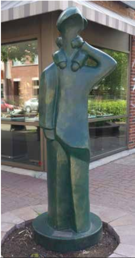
Oeuvre d'art au 1543, rue Fleury Est au coin de la rue Curotte

Cet architecte a également dessiné les stations Villa-Maria et Université-de-Montréal.