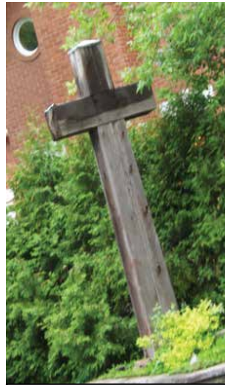
Croix de chemin sur le boulevard Gouin près de la rue Tolhurst

À l'extérieur, sur le boulevard Gouin, à l'angle de la rue Bois-de-Boulogne, une croix de chemin a été érigée en 1874. Cette croix, maintenant monument historique, est une des soixante croix de chemin qui datent du