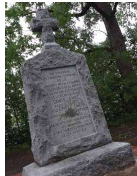
Stèle au parc Nicolas-Viel