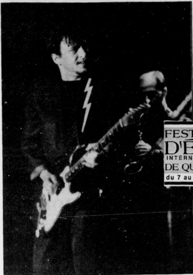
Chouchou du Festival d'été, le guitariste Colin James visitait de nouveau la scène du Pigeonnier, hier.