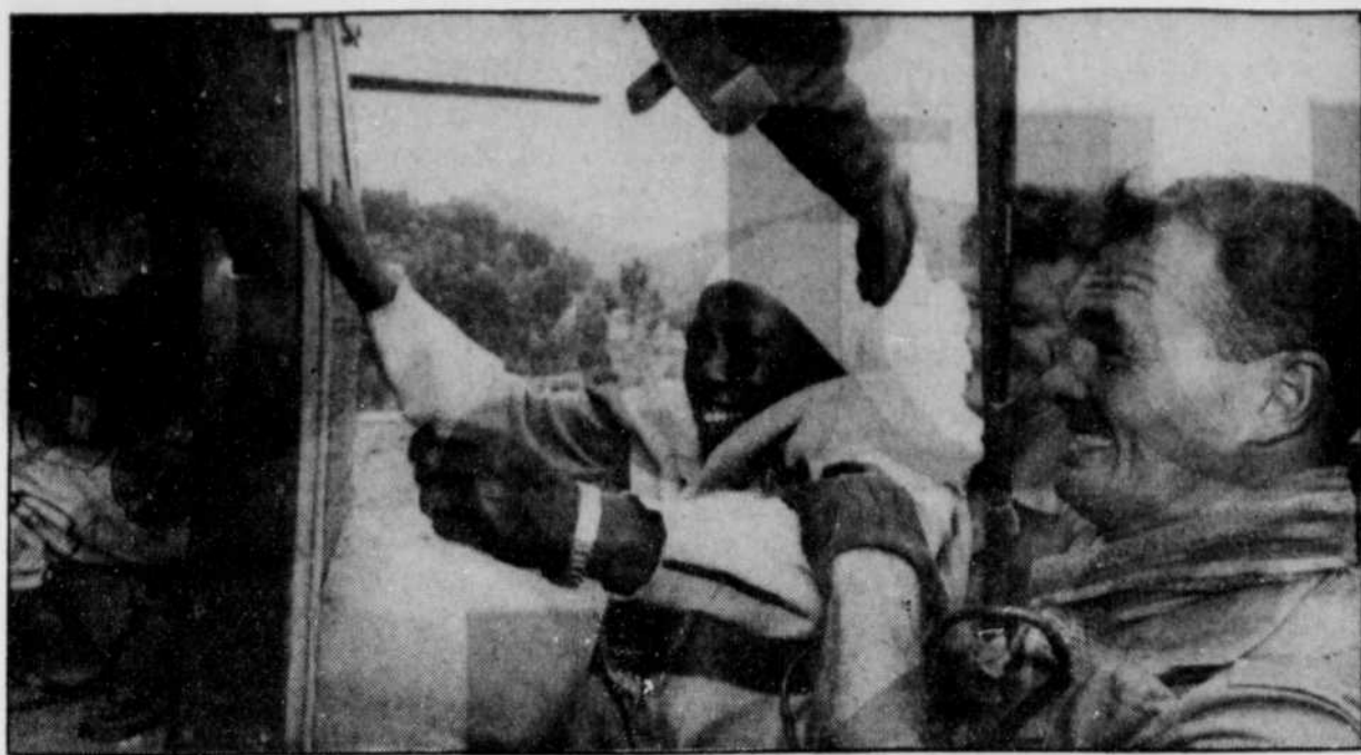
Des soldats français aident une religieuse du camp de réfugiés de Gikorongo à se hisser à bord d'un hélicoptère en partance pour Vukavu au Zaïre.

PHNOM PENH (AP, Reuter) — Le Parlement cambodgien a voté hier à l'unanimité la mise hors-la-loi des Khmers rouges, et le Premier ministre le Prince Norodom Ranariddh a annoncé que le Cambodge allait immédiatement demander à des pays comme la Thaïlande, qui laisse les Khmers rouges emprunter son territoire, de les arrêter et de les renvoyer au Cambodge. Le gouvernement va également demander aux autres pays de saisir les biens des Khmers rouges, biens considérés comme importants notamment grâce au trafic illégal qui se fait à la frontière avec des hommes d'affaires thaïlandais. Ce trafic serait de l'ordre de 20 millions de dollars US par mois. Les Khmers Rouges occupent actuellement environ 10 % du Cambodge et disposent d'environ 9000 hommes.