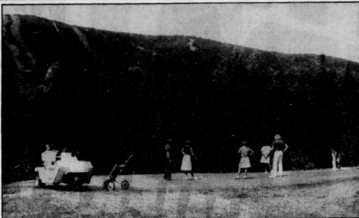
Le PQ demande un moratoire sur la privatisation du Mont-Sainte-Anne.

— Enfin, la Commission de révision des marchés publics sera fusionnée au Tribunal canadien du commerce extérieur.