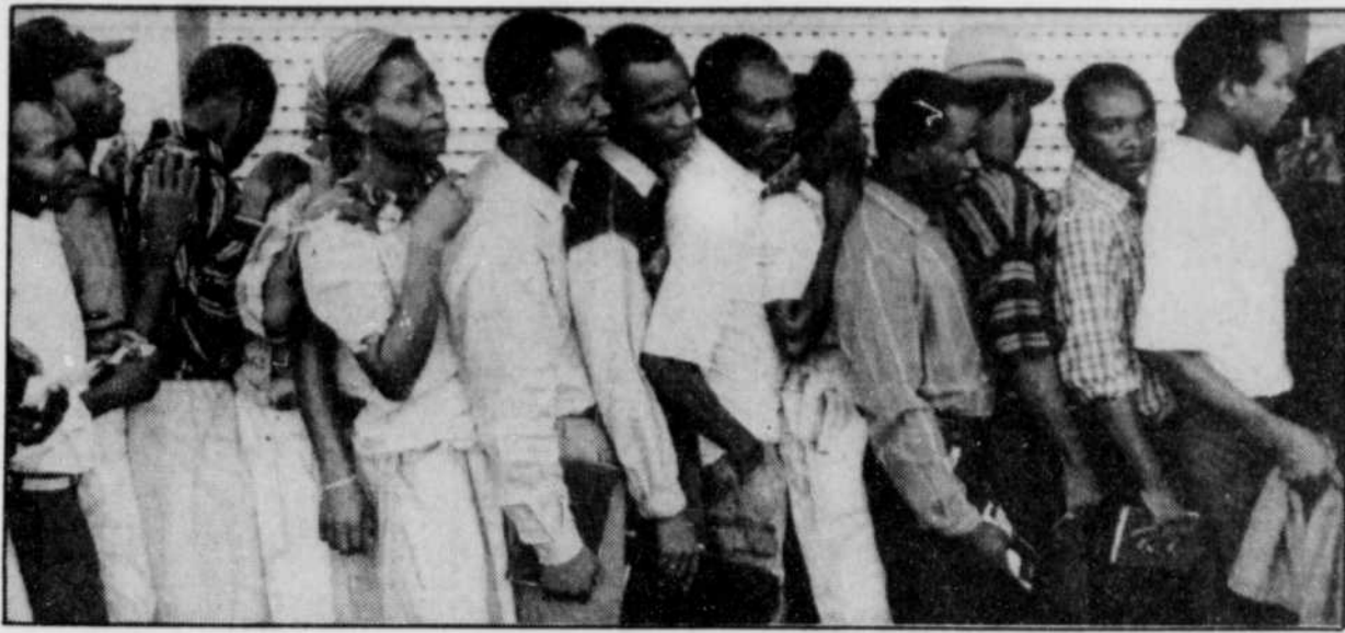
Des centaines d'Haïtiens désireux d'obtenir l'asile politique aux États-Unis faisaient la queue hier, dès l'aurore, devant le centre de traitement de Port-au-Prince. Seulement 60 ont réussi à remplir les formalités. On estime à moins de cinq pour cent les demandes d'asile qui seront acceptées.

Pendant une visite de la ville, qui a duré deux heures, il a été impossible d'établir qui, parmi ces gens acclamant les vainqueurs, portait les armes contre eux il y a seulement un jour ou deux jours, ou se réjouissait de la proclamation de sécession du Sud le 21 mai.