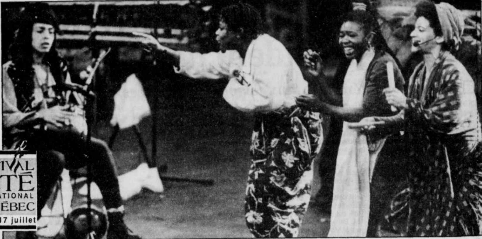
Les filles de Zap Mama ont réchauffé l'assistance en cette fraîche soirée.

FESTIVAL D'ÉTÉ INTERNATIONAL DE QUÉBEC du 7 au 17 juillet