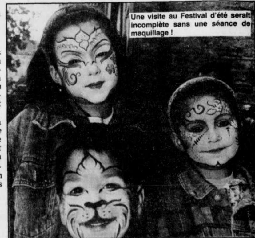
Une visite au Festival d'été serait incomplète sans une séance de maquillage !

ANGELA HEWITT, pianiste, présentée par le Festival d'été de Québec. Programme entièrement consacré à Jean-Sébastien Bach et comprenant quatre Préludes et Fugues , quinze Inventions , quinze Sinfonies et la Fantaisie chromatique et fugue en ré mineur . Au Palais Montcalm, hier.