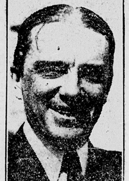
OWEN-D. YOUNG, collaborateur du général Dawes dans les questions des réparations, nommé agent général temporaire des réparations.