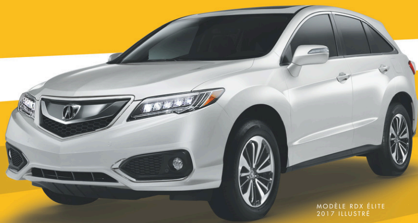
MODÈLE RDX ÉLITE 2017 ILLUSTRÉ