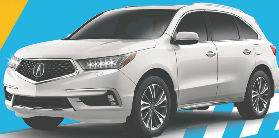
MODÈLE MDX ÉLITE 2017 ILLUSTRÉ

RECEVEZ 4500$ † OU RABAIS COMPTANT SUR LES MODÈLES MDX NAVI, TECH ET ÉLITE 2017