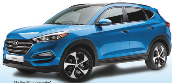
Modèle Ultimate montré*

WWW.GROUPEBD.COM WWW.GROUPEBD.COM WWW.GROUPEBD.COM WWW.GROUPEBD.COM WWW.GROUPEBD.COM WWW.GROUPEBD.COM