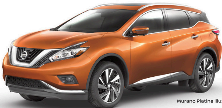
Murano Platine illustré*

AU FINANCEMENT À UN TAUX STANDARD* (sur le Rogue S).