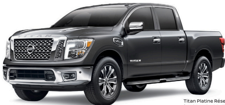
Titan Platine Réserve à cabine double illustré*