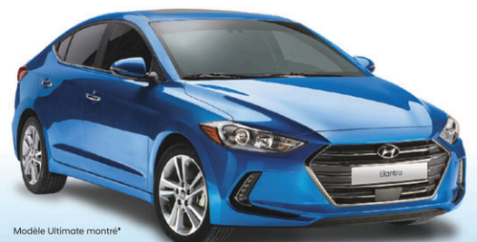
Modèle Ultimate montré*