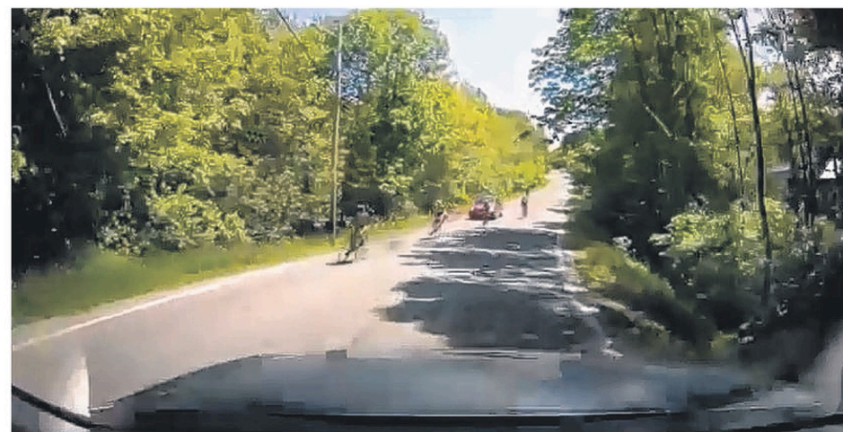
Sur cette photo, on aperçoit le groupe de cyclistes filant à vive allure sur le chemin du mont Shefford qui effectue un dépassement illégal entre deux voitures.