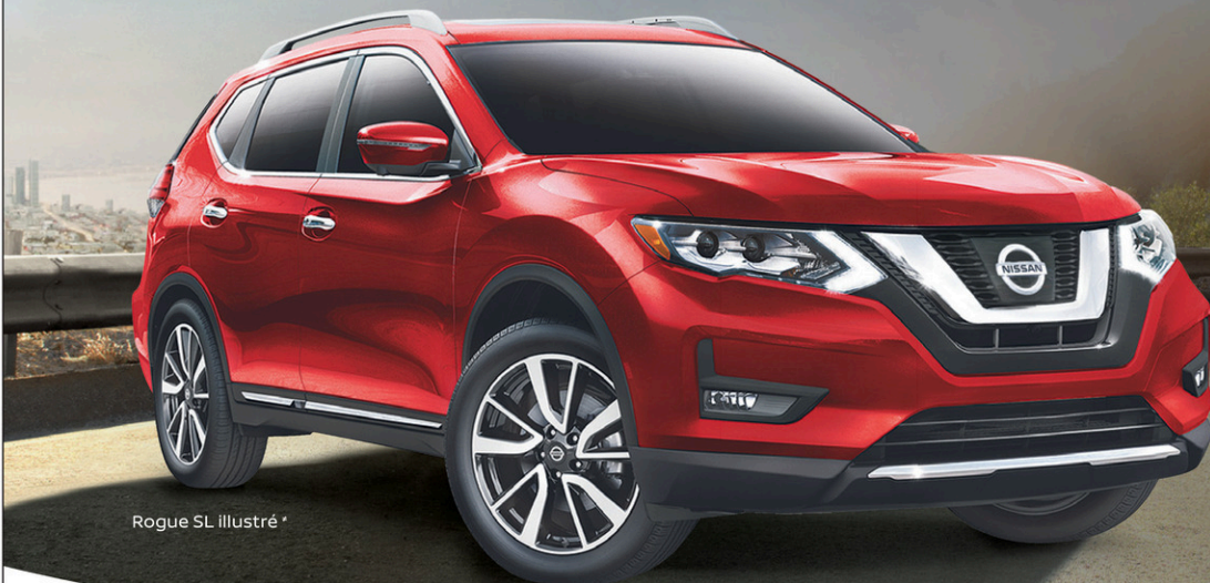
Rogue SL illustré *