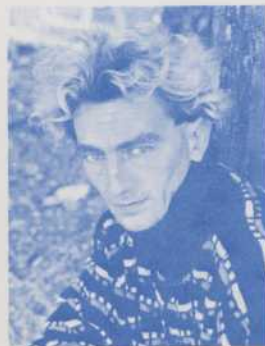
MARC PERRIER