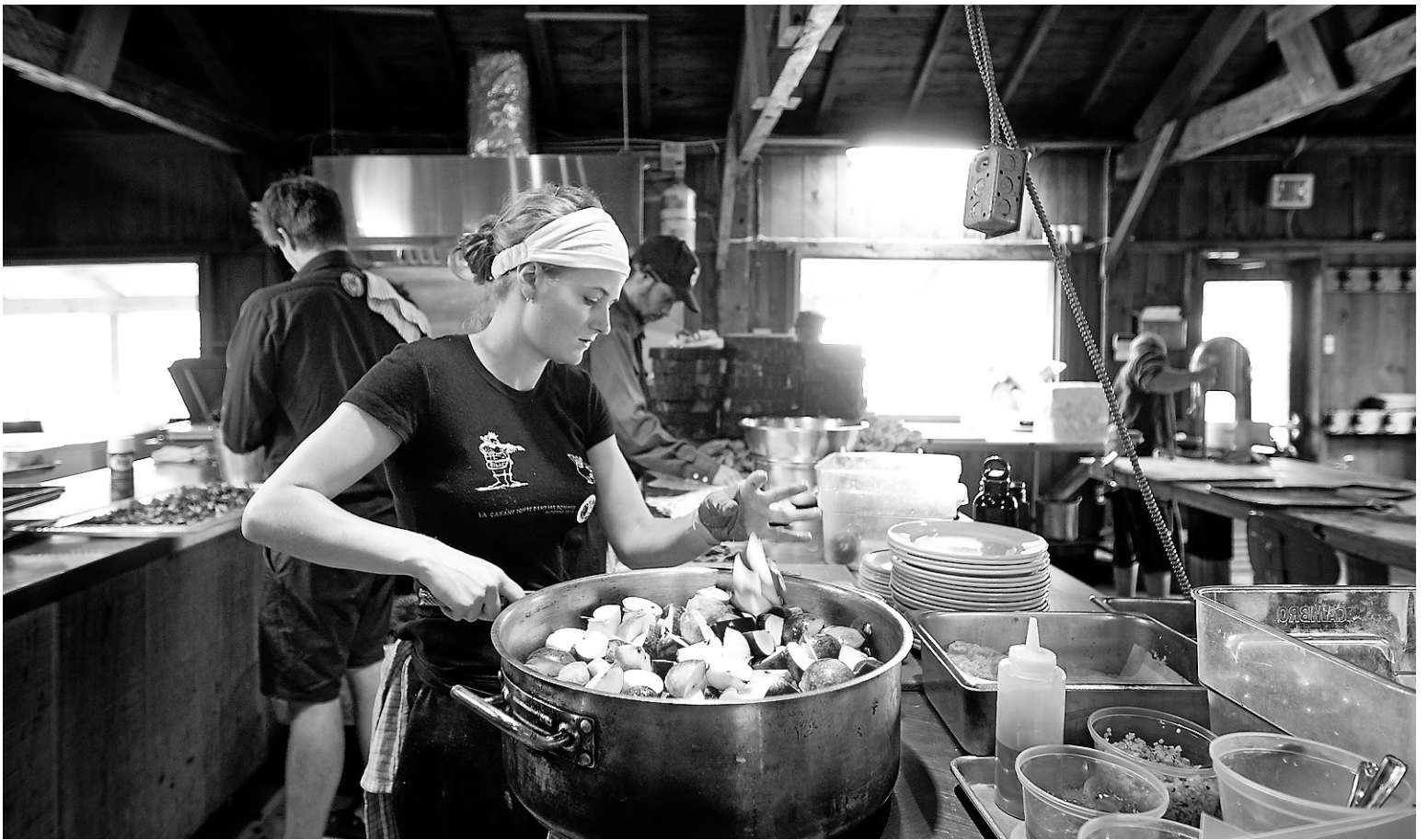
La cabane à sucre du Pied de cochon offre un menu dont l'élément central est la pomme.

Sauces aux pommes, jus, cidre, morceaux de pomme, pommettes entières... Le fruit se retrouve un peu partout dans le repas. Du cocktail au dessert en passant par tous les plats salés.