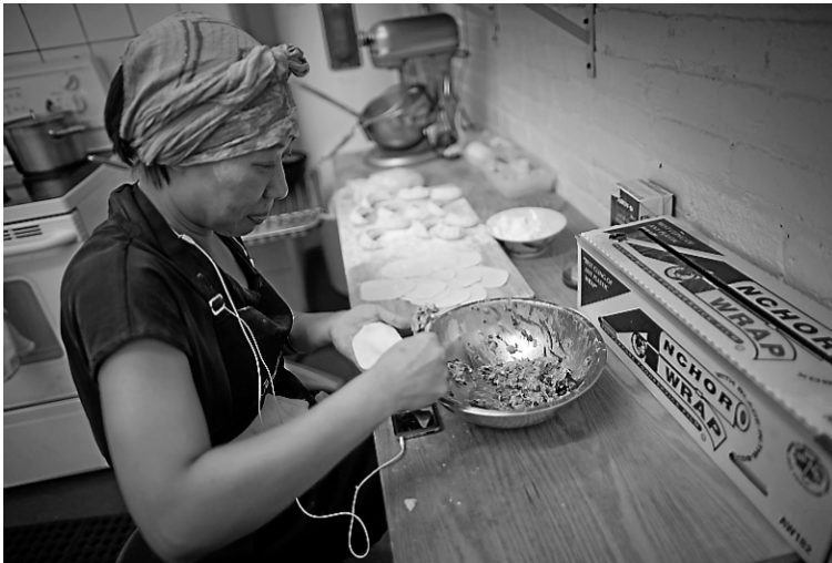
Différentes saveurs de dumplings sont offertes à ce nouveau comptoir.

Sur l'une des 3 tables et 12 chaises (le nombre de places maximales autorisées aux détenteurs d'un permis de dépanneur), le festin commence. Salade froide, végétarienne, de nouilles soba au sarrasin, juliennes de concombres et carottes crues, graines de sésame, oignons verts et sauce hoïsin. C'est frais, croquant. Il faudra revenir goûter la soupe (raviolis chinois porc-crevettes, bouillon de poulet, légumes et bok choi), remède miracle à la déprime automnale, selon M. Brûlé. Côté dumplings, on opte pour un classique: porc, gingembre et oignons verts, en versions miniatures, pochés