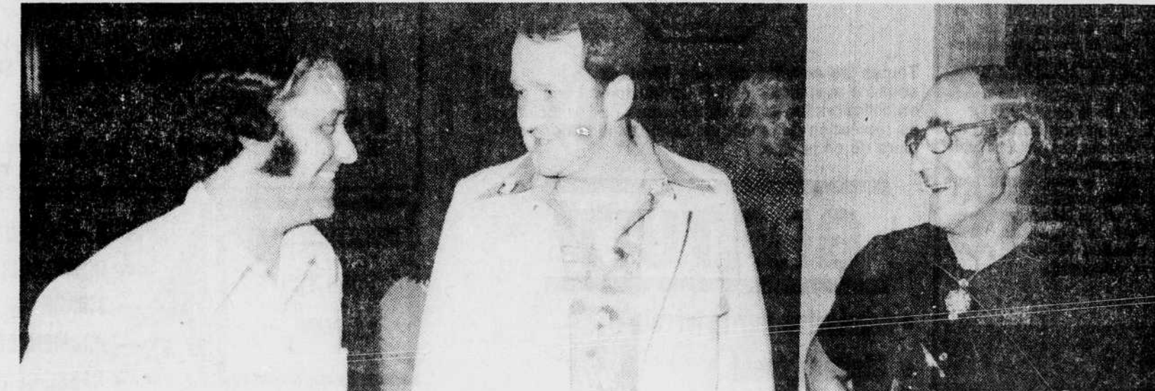
Cinq autres compagnies