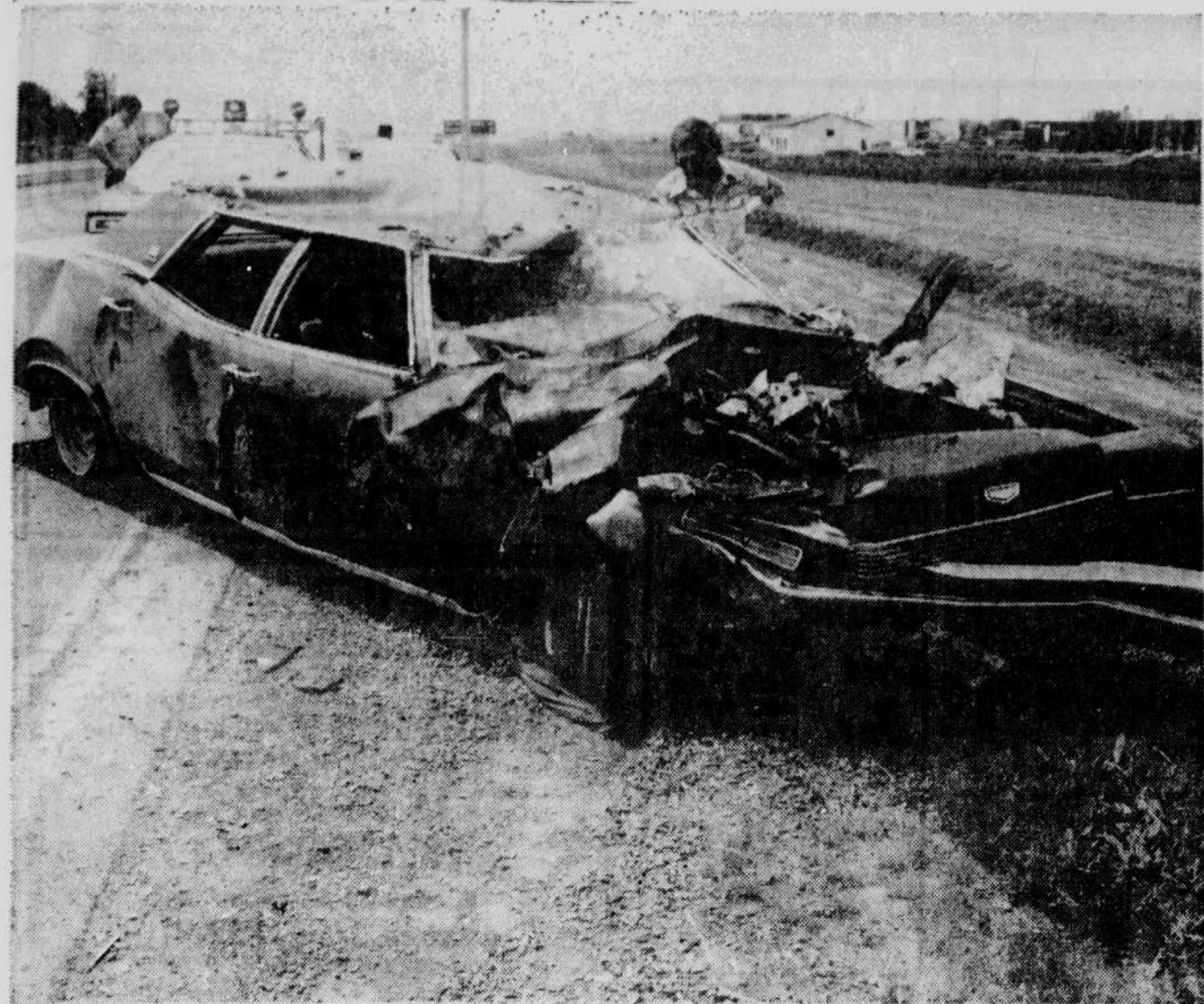
L'auto de M. Sarrazin a mangé un dur coup, comme on a pu le constater hier midi, sur l'autoroute 20.