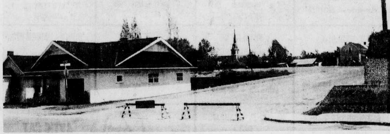
Travaux de pavage Plusieurs artères de la Cité de Thetford Mines sont actuellement fermées à la circulation pour des travaux de pavage.