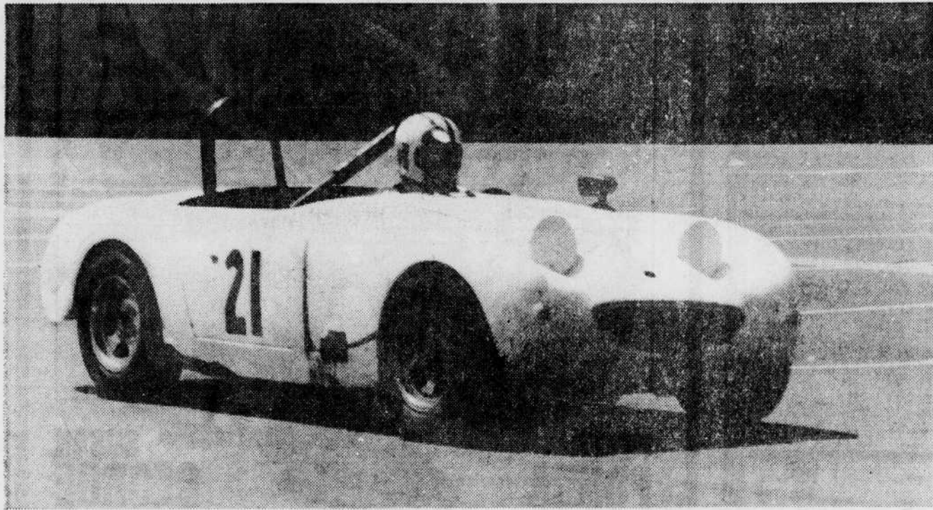
Une soixantaine de pilotes licenciés de la Fédération Auto Québec seront à Drummondville dimanche lors du slalom CADAC comptant pour le championnat provincial 1975.