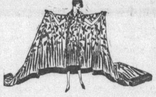
Au deuxième, chez Eaton.

DANS les robes de voile — il ne faut pas oublier que le voile est toujours aimé pour l'été — nous avons un modèle en voile rose ou vert, brodé à jour en un grand dessin ininterrompu en avant et en arrière tandis que les côtés sont en voile uni. Le col et les manches sont bordés de dentelle et un long ruban noir descend en avant. Taille : 15.00 18 et 38 ... 60.00