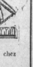
Au rez-de-chaussée, chez Eaton.